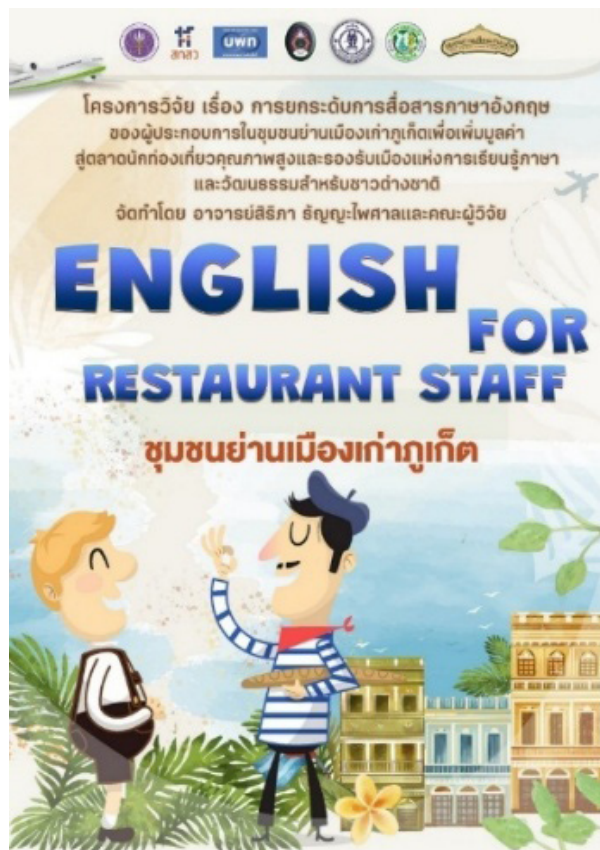
Figure 3. Training Manual: English for Restaurant Staff Course

ทั้งนี้ ผู้วิจัยได้เผยแพร่คู่มือการฝึกอบรมการสื่อสารภาษาอังกฤษสำหรับผู้ประกอบการร้านอาหารในพื้นที่ชุมชนย่านเมืองเก่าภูเก็ต (English for Restaurant Staff) กับผู้เข้าร่วมฝึกอบรม ชุมชนย่านเมืองเก่าภูเก็ต ผู้ประกอบการร้านอาหารอื่น ๆ ที่สามารถนำคู่มือไปใช้เพื่อการยกระดับการสื่อสารภาษาอังกฤษของผู้ประกอบการในชุมชนย่านเมืองเก่าภูเก็ตเพื่อเพิ่มมูลค่าสู่ตลาดนักท่องเที่ยวคุณภาพสูง และรองรับเมืองแห่งการเรียนรู้ภาษาและวัฒนธรรมสำหรับสำหรับชาวต่างชาติ