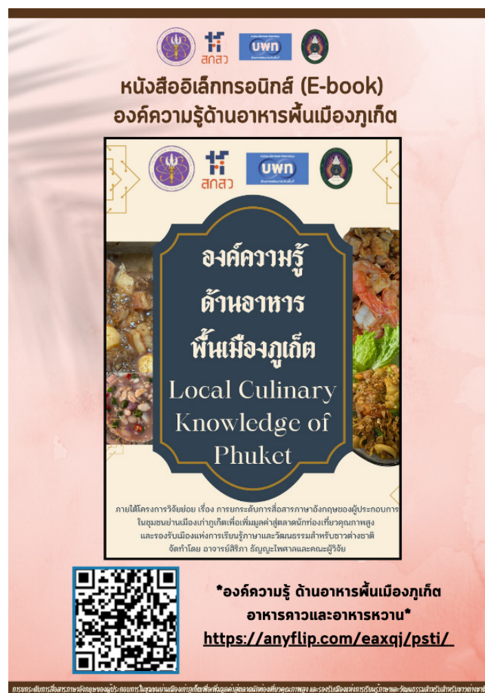
Figure 2. E-book Local Culinary Knowledge of Phuket

องค์ความรู้ด้านอาหารพื้นเมืองภูเก็ต ซึ่งในโดยเนื้อหาในเล่มจัดทำในรูปแบบสองภาษา (ไทย-อังกฤษ) ทั้งนี้ ได้มีการรวบรวมองค์ความรู้ด้านอาหารพื้นเมืองภูเก็ตประเภทอาหารคาว จำนวน 6 เมนู ประกอบด้วย 1. หมูฮ้อง (Red Braised Pork Belly) 2. ผัดหมี่ฮกเกี้ยน (Hokkien Noodles) 3. โอวต้าว (Phuket Fried Oyster and Taro (O-Tao) 4. แกงส้มปลากุเลา (Southern Thai Yellow Curry Fish) 5. น้ำชุบหย่า (Southern Thai Chili Shrimp Paste Dip or Nam Chup Yam) และ 6. หมี่หุ่นปะฉ่าง (Rice Noodles with Pork-ribs soup or Mee Hun Pa Chang) นอกจากนี้ องค์ความรู้ด้านอาหารพื้นเมืองภูเก็ตประเภทอาหารหวาน จำนวน 7 เมนู ประกอบด้วย 1. โอ้เอ๋ว (O-aew) 2. บีโกหมอย (Black Glutinous Rice Dessert Soup (Bee Koh Moy)) 3. ขนมองกู่ (Turtle Mung Bean Paste (Ang-Ku)) 4. ขนมปาวหล้าง (Khanom Pao Lang) 5. ขนมอาโป้ง (Khanom Ahpong) 6. ขนมไก่อีตลาลัม (Khanom Koi Talam) และ 7. ขนมเกี่ยมโก้ย (Khanom Keam Koey) ในประเด็นสำคัญในการจัดทำองค์ความรู้ด้านอาหารพื้นเมืองภูเก็ต มีการใช้ภาษาในเมนูอาหาร เพื่อช่วยสร้างภาพลักษณ์และเอกลักษณ์ของร้านในมุมมองนักท่องเที่ยวต่างชาติ และองค์ประกอบทางวัฒนธรรมของเมนู เพื่อสะท้อนความสัมพันธ์ของคนภูเก็ตกับอาหารในชีวิตประจำวันและพิธีกรรมท้องถิ่น ในการนี้ ได้มีการเผยแพร่องค์ความรู้ในร้านอาหารในชุมชนย่านเมืองเก่าภูเก็ต ตลอดจนการเผยแพร่ผ่านสื่อโซเชียลมีเดียของชุมชนวิสาหกิจชุมชน หรือช่องทางอื่น ๆ ผ่าน QR Code หรือผ่านลิงก์ https://anyflip.com/eaxqj/vawf/ สำหรับการเผยแพร่เพื่อขับเคลื่อนเมืองเก่าภูเก็ต สู่มืองแห่งการเรียนรู้ ภาษาและวัฒนธรรมสำหรับชาวต่างชาติ