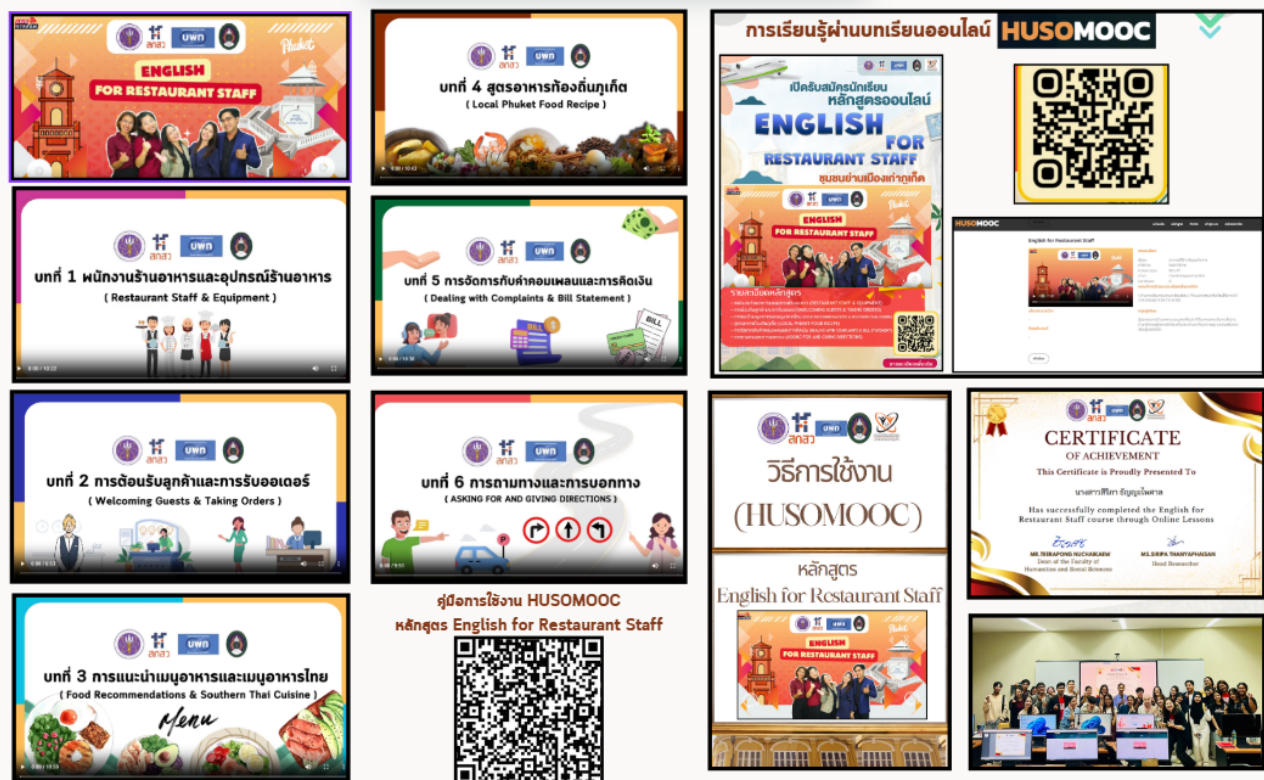
Figure 4. Online Lessons and the HUSO MOOC System: English for Restaurant Staff Course