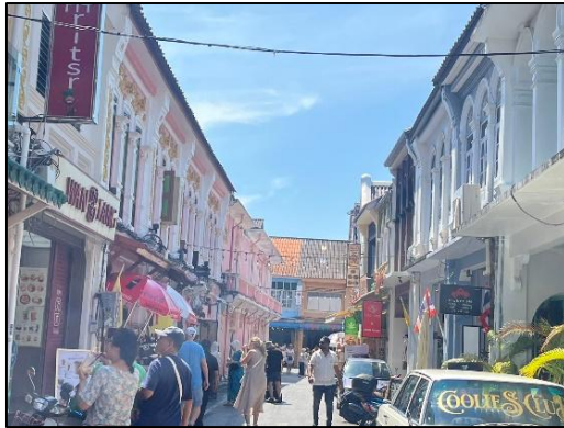
ภาพที่ 2 อาคารตึกแถวสถาปัตยกรรมซิโน-ยูโรเปียนในย่านเมืองเก่าภูเก็ต

(2) แบบคฤหาสน์ (Mansion) คิดเป็นร้อยละ 11.8% เป็นอาคารขนาดใหญ่ที่สร้างขึ้นโดยตระกูลนายเหมืองและพ่อค้าผู้มีฐานะทางเศรษฐกิจสูง มีการออกแบบผังอาคารที่กว้างขวาง และตกแต่งด้วยองค์ประกอบทางสถาปัตยกรรมอย่างประณีต เช่น ลวดลายปูนปั้น ชุมโค้ง และการใช้วัสดุที่นำเข้ามาจากต่างประเทศ ซึ่งสะท้อนถึงฐานะทางสังคมและความมั่งคั่งของเจ้าของอาคารในช่วงเวลานั้น นอกจากนี้ อาคารคฤหาสน์ยังมักมีการจัดวางพื้นที่ภายในอย่างเป็นสัดส่วน มีลานภายในหรือพื้นที่เปิดโล่งเพื่อช่วยในการระบายอากาศ และแสดงให้เห็นถึงอิทธิพลของสถาปัตยกรรมตะวันตกที่ผสมผสานกับแนวคิดการใช้พื้นที่แบบจีน อันเป็นผลมาจากบริบททางเศรษฐกิจและสังคมของจังหวัดภูเก็ตในช่วงที่อุตสาหกรรมเหมืองแร่ดีบุกมีความเจริญรุ่งเรือง ทั้งนี้ อาคารคฤหาสน์บางส่วนไม่สามารถบันทึกภาพประกอบได้ เนื่องจากข้อจำกัดในการเข้าถึงพื้นที่ในช่วงเวลาการสำรวจภาคสนาม