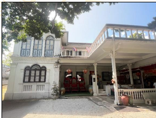
ภาพที่ 3 บ้านจีนประชา สถาปัตยกรรมแบบซิโน-ยูโรเปียน ในย่านเมืองเก่าภูเก็ต ที่มา : อภรณ์ พิเศษศิลป์ (2569)

(2) แบบคฤหาสน์ (Mansion) คิดเป็นร้อยละ 11.8% เป็นอาคารขนาดใหญ่ที่สร้างขึ้นโดยตระกูลนายเหมืองและพ่อค้าผู้มีฐานะทางเศรษฐกิจสูง มีการออกแบบผังอาคารที่กว้างขวาง และตกแต่งด้วยองค์ประกอบทางสถาปัตยกรรมอย่างประณีต เช่น ลวดลายปูนปั้น ชุมโค้ง และการใช้วัสดุที่นำเข้ามาจากต่างประเทศ ซึ่งสะท้อนถึงฐานะทางสังคมและความมั่งคั่งของเจ้าของอาคารในช่วงเวลานั้น นอกจากนี้ อาคารคฤหาสน์ยังมักมีการจัดวางพื้นที่ภายในอย่างเป็นสัดส่วน มีลานภายในหรือพื้นที่เปิดโล่งเพื่อช่วยในการระบายอากาศ และแสดงให้เห็นถึงอิทธิพลของสถาปัตยกรรมตะวันตกที่ผสมผสานกับแนวคิดการใช้พื้นที่แบบจีน อันเป็นผลมาจากบริบททางเศรษฐกิจและสังคมของจังหวัดภูเก็ตในช่วงที่อุตสาหกรรมเหมืองแร่ดีบุกมีความเจริญรุ่งเรือง ทั้งนี้ อาคารคฤหาสน์บางส่วนไม่สามารถบันทึกภาพประกอบได้ เนื่องจากข้อจำกัดในการเข้าถึงพื้นที่ในช่วงเวลาการสำรวจภาคสนาม