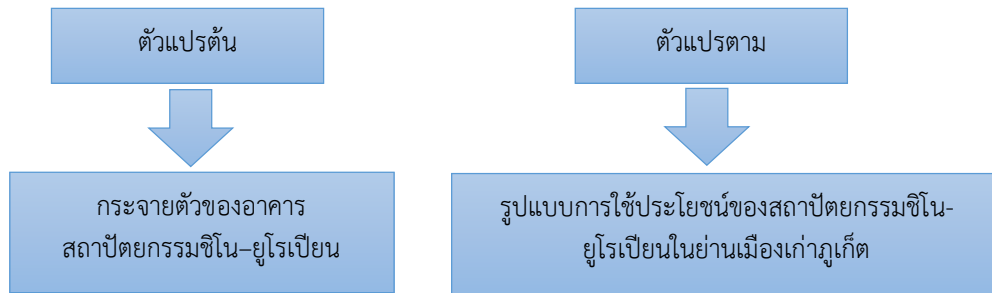
ภาพที่ 1 กรอบแนวคิดในการดำเนินงานวิจัย