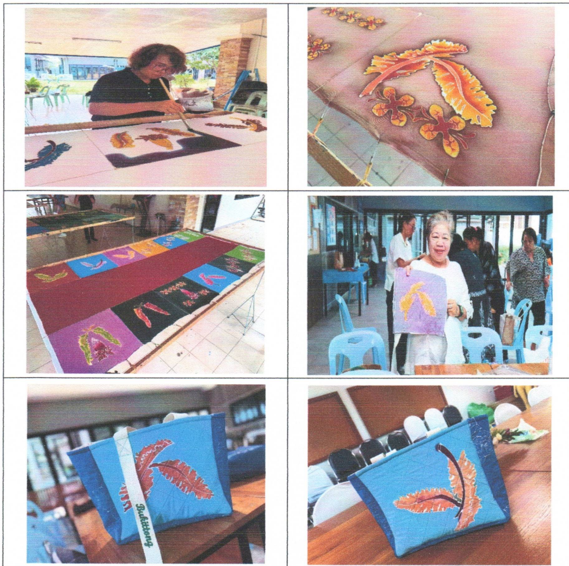
ภาพประกอบการนำ...

ภาพประกอบการนำผลงานวิจัยไปใช้ประโยชน์ หรือหลักฐานในการนำผลงานวิจัยไปใช้ในการอ้างอิง