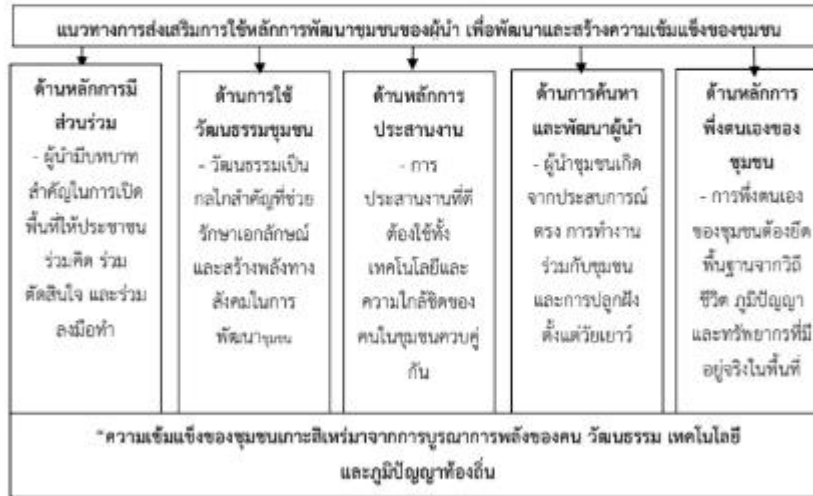
ภาพที่ 2 สรุปองค์ความรู้ใหม่