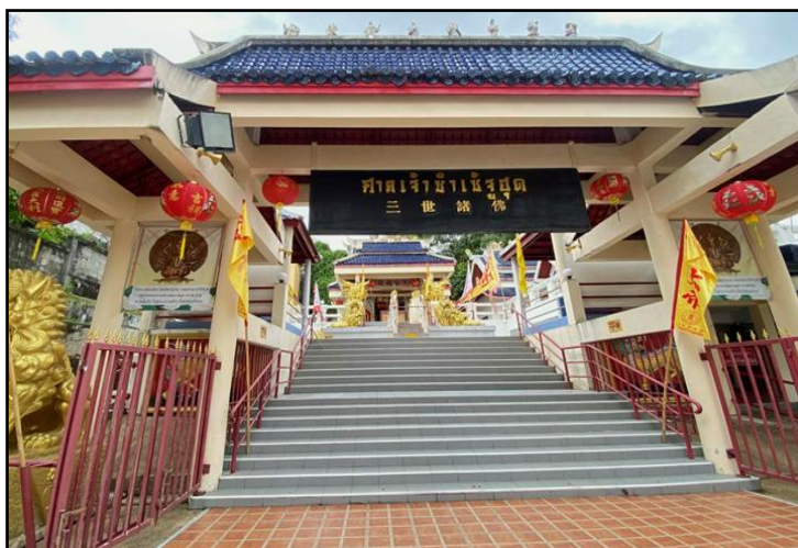
ภาพที่ 7 : ศาลเจ้าเจ้าเจ้าเจ้าสุด

กลุ่มที่ 3 กลุ่มที่ความหลากหลายของบทบาท ทั้ง 3 แห่งนี้ช่วยให้งานวิจัยของคุณครอบคลุมวงจรชีวิตของเมืองเก่า ตั้งแต่จุดที่สงบเงียบเพื่อการฝึกจิต คือ ศาลเจ้าเจ้าเจ้าเจ้าสุด ไปจนถึงจุดที่ดงามเพื่อการเรียนรู้อดีต คือ ศาลเจ้าแสงธรรม และจุดที่คึกคักเพื่อการขับเคลื่อนสังคม ได้แก่ ศาลเจ้าบางเหนียวตัววโบ้แก้ง (1) ศาลเจ้าเจ้าเจ้าเจ้าสุดก่อตั้งขึ้นในปี พ.ศ. 2544 การก่อสร้างแล้วเสร็จและมีพิธีเปิดอย่างเป็นทางการในเดือนพฤษภาคม พ.ศ. 2545 อาคารศาลเจ้าออกแบบด้วยสถาปัตยกรรมแบบจีนที่ดงาม ตกแต่งภายในอย่างประณีตประกอบด้วยรูปปั้นและภาพแกะสลักต่าง ๆ โดยภายในห้องโถงกลางประดิษฐานพระพุทธรูปและพระอรหันต์หลายองค์ ลักษณะเด่นของศาลเจ้าเจ้าเจ้าเจ้าสุดคือการเป็นศาลเจ้าในสายพระโพธิสัตว์ซึ่งเน้นหนักไปที่การปฏิบัติธรรมผ่านกิจกรรมต่าง ๆ อาทิ การสวดมนต์ ภาวนา การฝึกจิต และการนั่งสมาธิกรรมฐาน เพื่อส่งเสริมความสงบสุขและสวัสดิภาพแก่ผู้ที่มีร่วมทำบุญและปฏิบัติธรรม ศาลเจ้าแห่งนี้จึงสะท้อนถึงการผสมผสานระหว่างความเชื่อทางพุทธศาสนานิกายมหายานกับแนวทางการปฏิบัติธรรมที่เน้นการพัฒนาจิตใจของชุมชนจีนในภูเก็ตยุคปัจจุบัน (Phuket E-Magazine, 2567)