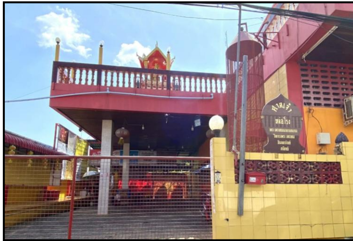
ภาพที่ 5 : ศาลเจ้าชู่ยี่ปุ่นตอง

ทางซ้าย สะท้อนการจัดระเบียบทางศาสนาและการบริหารจัดการที่เป็นระบบของชุมชนชาวจีนในภูเก็ต (Phuket E-Magazine, 2567)