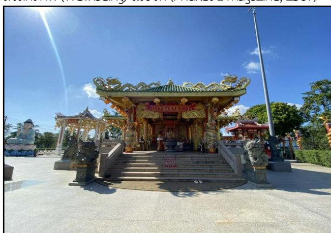
ภาพที่ 3 : ศาลเจ้ากิ้วเทียนแก๊ง

(3) ศาลเจ้ากิ้วเทียนแก๊ง ตั้งอยู่บริเวณปลายแหลมสะพานหินซึ่ง ชื่อ "กิ้วเทียนแก๊ง" แปลว่า "วังเก้าชั้นฟ้า" ตั้งตามความเชื่อว่าเป็นที่ประทับของเทพเจ้าสูงสุด คือ องค์กิ้วอ๋องไต่เต่ หรือเทพเจ้า 9 องค์ ที่เสด็จลงมาจกสวรรค์ชั้นที่ 9 ในอดีตบริเวณนี้เป็นพื้นที่ว่างเปล่ามีเพียงศาลเล็กสำหรับสักการะสิ่งศักดิ์สิทธิ์ แต่เมื่อเทศกาลถือศีลกินผักได้รับความนิยมเพิ่มมากขึ้น ศาลเจ้าจึงได้รับการพัฒนาและปรับปรุง พิธีกรรมที่สำคัญที่สุดและทำให้ศาลเจ้าแห่งนี้โดดเด่นคือพิธีอัญเชิญองค์กิ้วอ๋องไต่เต่ ซึ่งจัดขึ้นในคืนก่อนวันเริ่มเทศกาลกินผักทุกปี โดยทำพิธีอัญเชิญเทพเจ้าขึ้นจากทะเล และนำไปประดิษฐานยังศาลเจ้าต่าง ๆ เพื่อเป็นประธานในพิธีกรรม เมื่อวิเคราะห้ผ่านเกณฑ์ความโดดเด่นทางด้านจิตวิญญาณ ศาลเจ้ากิ้วเทียนแก๊งทำหน้าที่เป็นตัวแทนของ การเยียวยาและสร้างความมั่นคงทางใจ ในภาวะที่บุคคลต้องเผชิญกับความเสี่ยงหรือการเปลี่ยนแปลง บทบาทนี้สะท้อนความหลากหลายของศาลเจ้าในฐานะจุดหมายปลายทางที่ไม่ใช่เพียงเพื่อโชคลาภ แต่เพื่อการแสวงหาความสงบและสวัสดิภาพ (Well-being) ในชีวิต (Phuket E-Magazine, 2567)