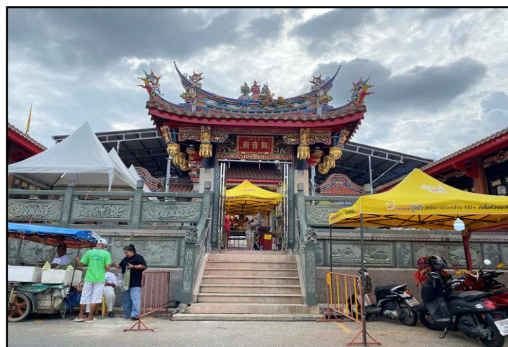
ภาพที่ 6 : ศาลเจ้าปู่ดจ้อ

(3) ศาลเจ้าปู่ดจ้อ ในช่วงแรกชาวบ้านเรียกศาลเจ้าแห่งนี้ว่า "ศาลเจ้าเต้จุ้น" หรือ "กวนอู" อันเป็นที่สักการะเทพเจ้ากวนอู ต่อมาเมื่อพ่อค้าเดินทางโดยเรือใบสามหลักจากปีนังมายังภูเก็ตเพื่อประกอบการค้าขาย โดยนำรูปแกะสลักไม้ขององค์พระโพธิสัตว์กวนอิมปู่ดจ้อติดตัวมาด้วย เมื่อพบเห็นสถานที่แห่งนี้และเกิดความรู้สึกว่าเป็นสถานที่ที่เหมาะสม จึงได้อัญเชิญพระโพธิสัตว์กวนอิมปู่ดจ้อมาประดิษฐาน ส่งผลให้ศาลเจ้าแห่งนี้เปลี่ยนชื่อมาเป็นศาลเจ้าปู่ดจ้อนับแต่นั้นมานอกจากนี้ศาลเจ้าแห่งนี้ยังมีชื่อเสียงในด้านการรักษาโรคด้วยวิธีเซียมซีนับเป็นเอกลักษณ์พิเศษที่หาชมได้ยากและสะท้อนถึงการผสมผสานระหว่างความเชื่อทางพุทธศาสนากับแนวทางการรักษาแบบดั้งเดิมของชุมชนจีนในภูเก็ต (Phuket E-Magazine, 2567)