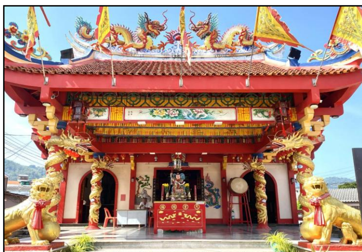
ภาพที่ 4 ศาลเจ้าหลิมฮู้ไ้ซู่