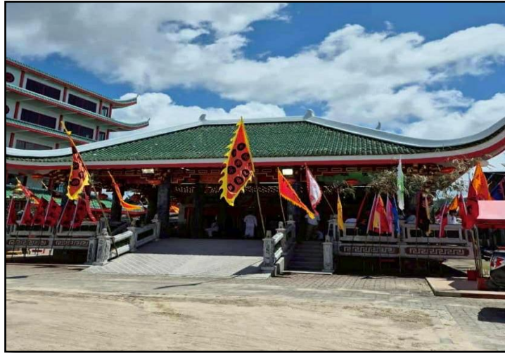
ภาพที่ 1 : ศาลเจ้าหล่าฮ่วยถู่ตัวโบ้เก็ง (ศาลเจ้ากะทู้)