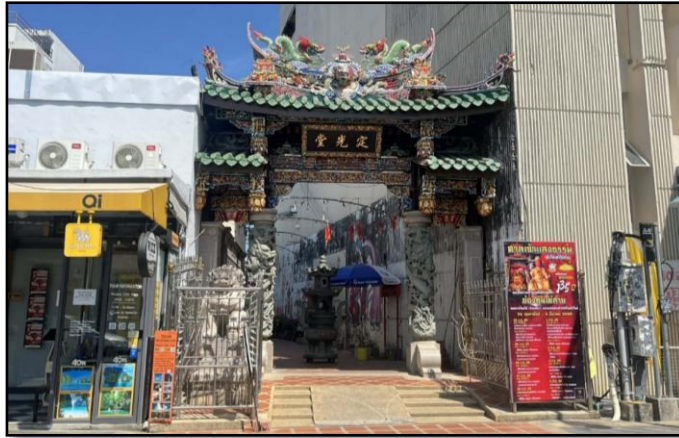
ภาพที่ 8 : ศาลเจ้าแสงธรรม