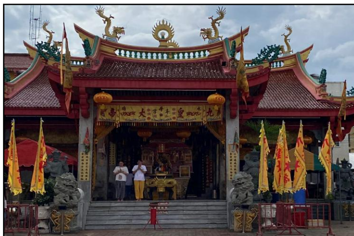
ภาพที่ 2 : ศาลเจ้าจู้ต๋วยเต้าไ้แก๊ง