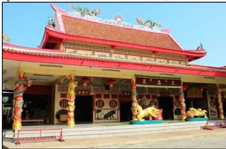
ภาพที่ 9 : ศาลเจ้าบางเหนียวตัววโป้แก้ง

(3) ศาลเจ้าบางเหนียวตัววโป้แก้ง หรือมูลนิธิเทพราศีเป็นศาลเจ้าเก่าแก่ที่มีมาตั้งแต่ พ.ศ. 2447 นับเป็นศาลเจ้าที่มีความสวยงามแห่งหนึ่งของจังหวัดภูเก็ต ประวัติความเป็นมาเริ่มต้นเมื่อคณะจิวจากเมืองจีน ชื่อ "คณะกังฉ้ายอี่" เดินทางมาแสดงจิวที่ตรอกเม่าแก้วและนำพระเตียนฮู้หวงโสัยมาบำเพ็ญกุศล เป็นจุดเริ่มต้นของประเพณีถือศีลกินผักในพื้นที่ ชาวบ้านเกิดความเลื่อมใสศรัทธาจึงเข้าร่วมถือศีลกินผักเป็นจำนวนมาก ต่อมาเกิดเหตุเพลิงไหม้ที่ศาลเจ้าเดิมโดยไม่ทราบสาเหตุที่แท้จริง ชาวบ้านจึงตัดสินใจนำพระเตียนฮู้หวงโสัยไปประดิษฐานที่ศาลเจ้าบางเหนียว ชาวบางเหนียวยังคงศรัทธาเหนียวแน่นจึงร่วมทำบุญบำเพ็ญกุศลและถือศีลกินผักทุกปี เมื่อมีผู้คนแวะเวียนมากขึ้นทำให้พื้นที่คับแคบ คณะที่นำโดยขุนเลิศโภคาร์กษจึงร่วมกันปรับปรุงและขยายศาลเจ้าให้รองรับผู้มาใช้บริการได้อย่างเหมาะสม (Phuket E-Magazine, 2567)