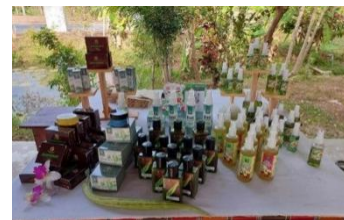
ภาพที่ 21 ผลิตภัณฑ์จากพืชสมุนไพร