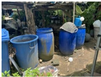
ภาพที่ 11 การผลิตปุ๋ยหมักชีวภาพ

ที่มา: เขาวลิต หมดสม ผู้ถ่ายภาพ (27/09/68)