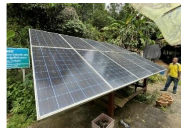
ภาพที่ 6 แผงโซลาเซลล์ผลิตน้ำ