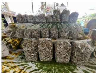
ภาพที่ 16 ผลิตภัณฑ์ชุมชน (ปลาฉิ่งฉ้าง) ที่มา: เขาวลิต หมดสม ผู้ถ่ายภาพ (03/10/68)