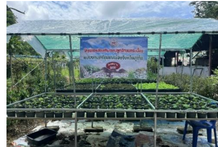
ภาพที่ 10 การปลูกผักแบบยกแคร่บนกระเบื้อง

(27/09/68)