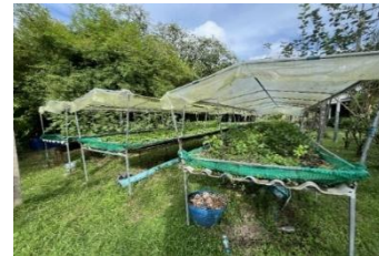
ภาพที่ 19 การปลูกผักแบบแคร่บนกระเบื้อง

ที่มา: เขาวลิต หมดสม ผู้ถ่ายภาพ (27/09/68)