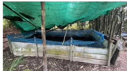
ภาพที่ 15 บ่อเลี้ยงปลา ที่มา: เขาวลิต หมดสม ผู้ถ่ายภาพ (03/10/68)