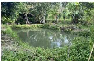
ภาพที่ 20 การเลี้ยงปลา

ที่มา: เขาวลิต หมดสม ผู้ถ่ายภาพ (27/09/68)