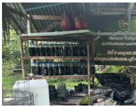
ภาพที่ 18 การทำน้ำหมักชีวภาพ

ที่ตั้ง อ่างเก็บน้ำบางเหนียวดำ หมู่ที่ 7 ตำบลศรีสุนทร อำเภอดงหลวง เกิดจากการที่ชาวบ้านเริ่มให้ความสนใจเกี่ยวกับการปลูกพืชไว้กินเอง ที่ไม่ผ่านการใส่สารเคมี เพราะชาวบ้านส่วนใหญ่มีอาชีพรับจ้าง จึงมีต้นทุนต่ำ และไม่มีพื้นที่ในการทำเกษตร จึงขออนุญาตใช้พื้นที่ของกรมชลประทาน โดยเริ่มต้นในปี 2557 มีสมาชิก 27 คน และปัจจุบันมีสมาชิก 46 คน ในระยะแรกมีอุปสรรคในเรื่องของพื้นที่ โดยพื้นที่ที่ตั้งของศูนย์เคยเป็นเหมืองแร่มาก่อน จึงเป็นพื้นดินทราย ไม่สามารถปลูกพืชได้ และพื้นที่ปล่องระดับ เป็นพื้นที่ที่มีน้ำท่วมขังหรือน้ำมาจากอ่างน้ำ จึงเป็นพื้นที่ชุ่มน้ำ จึงได้ขอความร่วมมือจากกรมพัฒนาที่ดินในเรื่องของการให้ความรู้เกี่ยวกับการทำถุขมิ้นแก้งดิน เพื่อมาสร้างเป็นธนาคารปุ๋ยอินทรีย์ ที่จะสามารถนำมาใช้ในพื้นที่ปัญหาต่อมา คือ การขาดองค์ความรู้ของชาวบ้านในด้านของการทำเกษตรและการแปรรูปจากพืชที่ปลูก จึงได้ขอความร่วมมือกับมหาวิทยาลัยราชภัฏภูเก็ต ตามพระราชโองบายของในหลวงรัชกาลที่ 10 ในโครงการพัฒนาท้องถิ่น ถือเป็น การสร้างภาคีเครือข่ายที่จะช่วยในการพัฒนาชุมชนเศรษฐกิจพอเพียงให้มีความยั่งยืน และส่งเสริมคุณภาพชีวิตของสมาชิก ศูนย์เรียนรู้แห่งนี้มุ่งเน้นการเกษตรอินทรีย์ การอนุรักษ์ทรัพยากรธรรมชาติและ การสร้างรายได้ที่ยั่งยืน โดยเน้นให้ชาวบ้านมีความรู้และทักษะสามารถพึ่งพาตนเองได้ กิจกรรมหลักของศูนย์ ได้แก่ การทำน้ำหมักชีวภาพ การปลูกผักแบบแคร่บนกระเบื้อง การเลี้ยงปลา และผลิตภัณฑ์จากพืชสมุนไพร