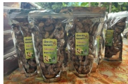
ภาพที่ 17 ผลิตภัณฑ์ชุมชน (เม็ดมะม่วงหิมพานต์) ที่มา: เขาวลิต หมดสม ผู้ถ่ายภาพ (03/10/68)