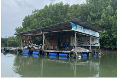
ภาพที่ 12 ธนาคารปูม้าบ้านบางโรง (01/10/68)