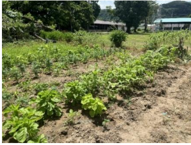
ภาพที่ 9 การปลูกผักสวนครัว

(27/09/68)