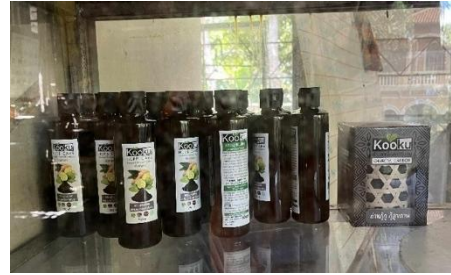
ภาพที่ 2 ผลิตภัณฑ์ชุมชน (แชมพูสมุนไพร)

ที่มา: เซาวลิต หมดสม ผู้ถ่ายภาพ (22/09/68)