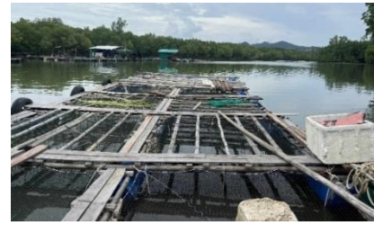
ภาพที่ 13 กระชังเลี้ยงปลา (01/10/68)