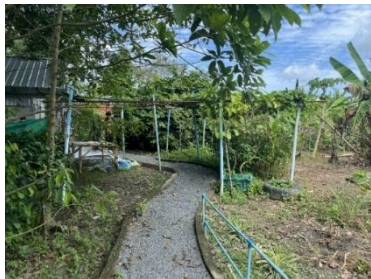
ภาพที่ 14 สวนผักสวนครัว ที่มา: เขาวลิต หมดสม ผู้ถ่ายภาพ (03/10/68)

ที่ตั้ง 24 หมู่ที่ 5 ตำบลศรีสุนทร อำเภอลาดหลุมแก้ว เป็นชุมชนที่นำหลักปรัชญาเศรษฐกิจพอเพียงมาใช้ในการพัฒนาชุมชน โดยได้รับงบประมาณจากกรมการพัฒนาชุมชนเพื่อดำเนินโครงการตามพระราชดำรินในหลวงรัชกาลที่ ๙ ที่มุ่งเน้นให้นักท่องเที่ยวมีส่วนร่วมทำกิจกรรมกับคนในชุมชน มีวัตถุประสงค์เพื่อเป็นแหล่งเรียนรู้วิถีวัฒนธรรมและวิถีชีวิตชุมชน โดยเน้นการเรียนรู้แบบลงมือทำตามแนวเศรษฐกิจพอเพียง เช่น การทำน้ำส้มควันไม้ การทำปุ๋ยหมัก และการมัดย้อมด้วยสีธรรมชาติ ซึ่งเป็นกิจกรรมที่สะท้อนถึงภูมิปัญญาท้องถิ่น และการอนุรักษ์สิ่งแวดล้อม นอกจากนี้ ชุมชนบ้านลิพอนใต้ยังเป็นส่วนหนึ่งของโครงการชุมชนท่องเที่ยว OTOP นวัตวิถี ซึ่งส่งเสริมการท่องเที่ยวเชิงวัฒนธรรมและวิถีชีวิตชุมชน โดยนักท่องเที่ยวสามารถสัมผัสและเรียนรู้กิจกรรมต่าง ๆ ที่ชุมชนจัดขึ้น กิจกรรมหลักของศูนย์ ได้แก่ การปลูกผักปลอดสารพิษ การเลี้ยงสัตว์แบบธรรมชาติ และผลิตภัณฑ์ชุมชน