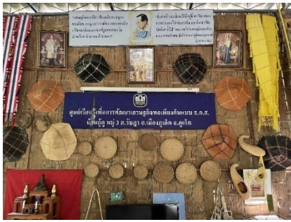
ภาพที่ 1 จักสานภูเก๊ต

ที่มา: เซาวลิต หมดสม ผู้ถ่ายภาพ (22/09/68)