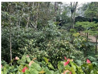
ภาพที่ 5 การปลูกผักพื้นบ้าน (ผักเหลียง)

ที่ตั้ง หมู่ที่ 5 ตำบลคลอง อำเภอมะนังภูเก็ต เป็นชุมชนต้นแบบที่นำปรัชญาเศรษฐกิจพอเพียงมาประยุกต์ใช้กับวิถีชีวิตและการประกอบอาชีพของสมาชิก โดยหมู่บ้านได้จัดตั้งกองทุนหมู่บ้านและกลุ่มเศรษฐกิจชุมชนเพื่อหมุนเวียนเงินภายในชุมชนและสร้างสวัสดิการให้กับสมาชิก ประกอบด้วยกองทุนหมู่บ้านเงินหมุนเวียน 1 ล้านบาท กลุ่มออมทรัพย์เพื่อการผลิตจำนวน 50 คน มีเงินทุนหมุนเวียน 31,250 บาท และกลุ่มเศรษฐกิจพอเพียงในชุมชนบ้านนากจำนวน 30 คน จุดประสงค์หลักเพื่อสนับสนุนการประกอบอาชีพของชาวบ้าน ทั้งการทำไร่ ทำสวน เลี้ยงสัตว์ และการออมเงินของสมาชิก โดยเริ่มแรกกลุ่มได้รับพระราชทานเงินจำนวน 20,000 บาท เป็นกองทุนสำรองจ่ายและแหล่งเงินหมุนเวียน กิจกรรมหลักของศูนย์ ได้แก่ การปลูกผักพื้นบ้านในสวนยางพารา การใช้พลังงานทดแทน การผลิตปุ๋ยหมัก น้ำหมักชีวภาพ การเพาะเห็ด และการแปรรูปผลิตภัณฑ์