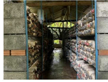
ภาพที่ 8 การเพาะเห็ด

ที่มา: เขาวลิต หมดสม ผู้ถ่ายภาพ (24/09/68)