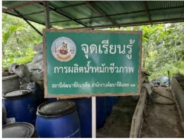
ภาพที่ 7 การผลิตน้ำหมักชีวภาพ

(24/09/68)