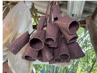
ภาพที่ 4 สบซู่ภูเก๊ต

(22/09/68)