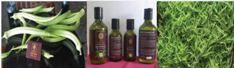
ภาพที่ 2 นวัตกรรมจากกระเจี๊ยบเขียวฝักใหญ่ “ถั่วเมือก”

ต่อมาในปี 2565 ผู้นำเสนอได้นำนักศึกษาทำงานในพื้นที่ชุมชนบ้านท่าหมึก ได้รับรางวัลนวัตกรรมอาหาร ระดับชาติ รองอันดับที่ 2 ในชื่อ มรกตอันดามัน : ลอดช่องกระเจี๊ยบเขียวอบแห้ง เป็นการนำเมือกกระเจี๊ยบเขียวนำมาทำเป็นเส้นลอดช่องสิงคโปร์ หลากหลายสี แต่มีส่วนผสมสำคัญจากเมือกกระเจี๊ยบเขียวเพื่อที่จะให้เมือกเข้าไปช่วยบำรุงรักษาระบบภายใน เช่น ลำไส้ และกระเพาะอาหาร ในอิม อาหารเป็นยา