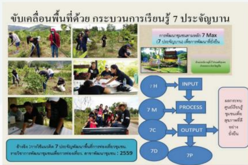
ภาพที่ 1 การเรียนรู้ด้วยรูปแบบ 7 ประจัญบานอย่างเป็นระบบ

ฐานเรียนรู้ของชุมชน สอนให้ชุมชนจับปลาให้เป็น เป็นวิทยากรได้ด้วยตนเอง พัฒนาศูนย์เรียนรู้ได้ด้วยตนเอง แต่ใช้กระบวนการพัฒนาแบบค่อยเป็นค่อยไป ไม่เร่งรีบ โดยที่ปรึกษาจะทำให้ดู อยู่ให้เห็นและสอนให้เป็นตาม กระบวนการที่วางไว้ ผู้เสนอ ศึกษาประวัติศาสตร์ ประเพณี วัฒนธรรมวิถีชีวิตชุมชน ค่านิยม ความเชื่อ ศาสนา จนเข้าใจอย่างลึกซึ้ง ลงพื้นที่พัฒนาวิจัยแบบฝังตัวเสมือนคนใน เป็นเสมือนลูกหลาน คนในชุมชนคนหนึ่ง จากนั้นใช้กระบวนการพัฒนาด้วยหลัก 7 ประจัญบาน ตัวป้อนเข้า Input ที่สำคัญ คือ 7 H การตระหนักรู้ตนเอง ด้วยการเรียนรู้บ้านแห่งความหวัง สู่กระบวนการบริหารจัดการเชิงนวัตกรรม 3 Process1. การบริหารจัดการ 7 MS+ การพัฒนาความคิดสร้างสรรค์ 7 C+ การพัฒนาโครงการนวัตกรรม 7D และส่งออกระบบการตลาด 7 P สร้างความแข็งแกร่งให้กับกลุ่มผ่านจิตวิญญาณการตระหนักรู้ในคุณค่าของตนเองด้วยแนวคิด Life Spring พัฒนาตนเองด้วยภาพลักษณ์ที่ดี การใช้พลังบวกในการแก้ไขวิกฤติ ในช่วงแรก ผู้นำเสนอจะคอยกระตุ้นชาร์ตพลังใจอย่างใกล้ชิด อยู่เป็นเพื่อนคู่ใจทั้งในพื้นที่ และในรูปแบบออนไลน์ ร่วมจัดทำข่าวภาคค่ำกับประธานกลุ่ม เชิญชวน ชี้นำให้สมาชิกได้สังเกตเห็นการพัฒนาในมุมมองใหม่ด้วยการนวัตกรรมใหม่จากพืชท้องถิ่น ที่เป็นทรัพยากรที่มีในพื้นที่ แม้ว่าจะเป็กลุ่มเกษตรกรขนาดเล็กแต่มีเอกลักษณ์ รู้จักคุณค่าในตนเอง สามารถสร้างมูลค่าเพิ่มในพื้นที่ที่จำกัดได้ สามารถสร้างรายได้เลี้ยงตนเองอย่างต่อเนื่องตามหลักเศรษฐศาสตร์เชิงพุทธ ด้วยแนวคิด จิวแต่แจ้ว Small is beautiful (E.F Chumacher. 1973) เพื่อสร้างผลผลิตของต้นแบบที่มีคุณภาพ มีประสิทธิภาพที่ดี และมีประสิทธิผลที่คุ้มค่า ชุมชนสามารถพึ่งตนเองได้อย่างสร้างสรรค์ และมีความสุข