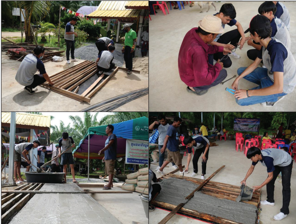
ภาพที่ 4 การปฏิบัติการของนักศึกษา ณ กลุ่มชุมชนห้วยยูง

นอกเหนือจากอาชีพการเพาะเห็ดแล้ว นักศึกษาสาขาวิชาเทคโนโลยีอุตสาหกรรม คณะวิทยาศาสตร์และเทคโนโลยี ยังได้ลงพื้นที่ร่วมจัดทำค่าง เพื่อรองรับการปลูกพริกไทย แก้วมังกร เพื่อเสริมอาชีพ สร้างรายได้อีกทางหนึ่ง แสดงดังภาพที่ 4