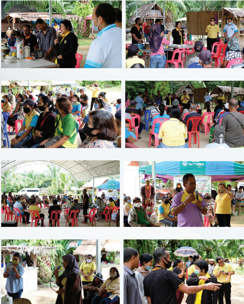
ภาพที่ 3 เดือนตุลาคม พ.ศ. 2563 คณะผู้บริหารมหาวิทยาลัยราชภัฏภูเก็ต ลงพื้นที่ชุมชนเจริญพัฒนา ตำบลห้วยยูง อำเภอเหนือคลอง จังหวัดกระบี่ รับฟังความต้องการของชุมชน

การดำเนินงานส่งเสริมอาชีพเพาะเห็ดอินทรี และการแปรรูป โดยใช้วิทยาศาสตร์เป็นฐาน แก่กลุ่มสมาชิกชุมชนประมาณ 50 คน เพื่อเสริมรายได้นั้น ได้ดำเนินงานอย่างต่อเนื่อง และผู้บริหารมหาวิทยาลัยฯ ได้ลงพื้นที่ตรวจเยี่ยมพื้นที่แห่งนี้ ในเดือนตุลาคม 2563 เพื่อรับฟังความต้องการของชุมชน แสดงดังภาพที่ 3