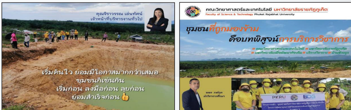
ภาพที่ 7 บุคลากรสายสนับสนุน คณะวิทยาศาสตร์และเทคโนโลยี ลงพื้นที่ ณ กลุ่มชุมชนห้วยยูง

สำหรับปี พ.ศ. 2565 บุคลากรสายสนับสนุน คณะวิทยาศาสตร์และเทคโนโลยี มหาวิทยาลัยราชภัฏภูเก็ต นำโดยคุณวรรณดี สวัสดิ์รักษ์ หัวหน้าสำนักงานคณบดีฯ พร้อมด้วย เจ้าหน้าที่สายสนับสนุนด้านต่าง ๆ ได้แก่ งานพัฒนานักศึกษา งานบริการวิชาการ งานธุรการ งานการเงิน การจัดซื้อจัดจ้างและบริหารพัสดุ งานด้านสื่อประชาสัมพันธ์ ลงพื้นที่ตำบลห้วยยูง จังหวัดกระบี่ ร่วมกับอาจารย์ผู้รับผิดชอบโครงการ พร้อมด้วยตัวแทนผู้บริหารคณะฯ เพื่อแลกเปลี่ยนประเด็นการทำงานร่วมกับชุมชน (ภาพที่ 7) โดยข้อมูลจากการลงพื้นที่ครั้งนี้ จะนำมาจัดทำเป็น (ร่าง) ระบบและกลไก การบริหารจัดการบุคลากรสายสนับสนุนภายในคณะฯ ที่เอื้อและหนุนเสริมให้สอดคล้องกับการทำงานเชิงพื้นที่ สิ่งเหล่านี้จะเป็นส่วนหนึ่งที่สำคัญต่อการขับเคลื่อนและตอบสนองการเป็นมหาวิทยาลัยฯ เพื่อพัฒนาท้องถิ่นและชุมชนอื่น ตามประกาศกฎกระทรวง เรื่อง การจัดกลุ่มสถาบันอุดมศึกษา พ.ศ. 2564