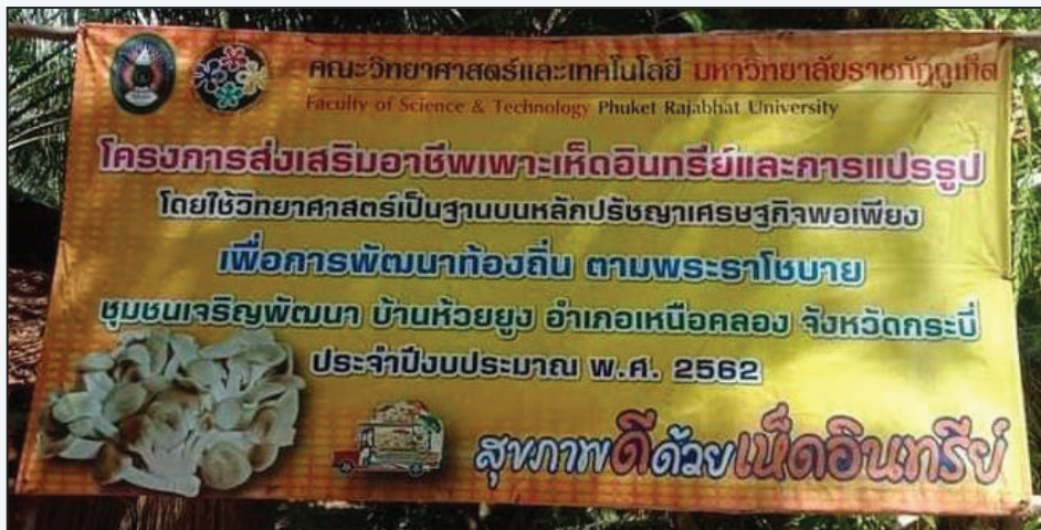
ภาพที่ 1 การส่งเสริมอาชีพการเพาะเห็ดและการแปรรูป

ปีงบประมาณ พ.ศ. 2562 มีผลผลิตจากการดำเนินงานโครงการส่งเสริมอาชีพเพาะเห็ดอินทรีและการแปรรูป โดยใช้วิทยาศาสตร์เป็นฐานบนหลักปรัชญาเศรษฐกิจพอเพียง เพื่อการพัฒนาท้องถิ่น ตามพระราชโองบาย ชุมชนเจริญพัฒนา บ้านห้วยยูง อำเภอเหนือคลอง จังหวัดกระบี่ ประจำปีงบประมาณ พ.ศ. 2562 ซึ่งเป็นปีที่ 1 ของการดำเนินงานของคณะทำงานครอบคลุมการทำงานส่งเสริมด้านต้นน้ำ กลางน้ำและปลายน้ำ คือ การเพาะเห็ดอินทรี แปรรูป งานด้านการตลาดและประชาสัมพันธ์ แสดงดังภาพที่ 1 และภาพที่ 2