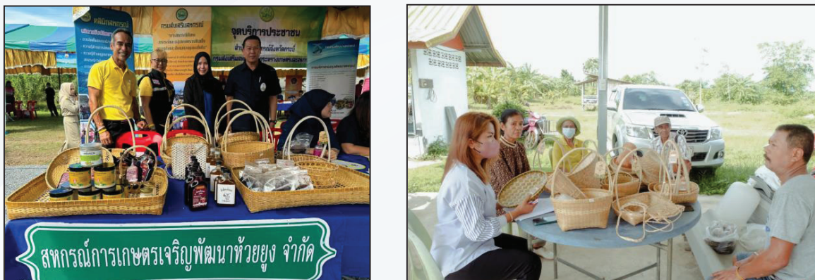
ภาพที่ 8 การติดตามการทำงานของกลุ่มชุมชน จากสถาบันวิจัยและพัฒนา มหาวิทยาลัยราชภัฏภูเก็ต

ปี พ.ศ. 2566 สถาบันวิจัยและพัฒนา มหาวิทยาลัยราชภัฏภูเก็ต ลงพื้นที่เพื่อติดตามผลการดำเนินงานของสหกรณ์การเกษตรเจริญพัฒนาห้วยยูง จำกัด ซึ่งเป็นกลุ่มเป้าหมายหนึ่งของการส่งเสริมอาชีพในตำบลห้วยยูง เพื่อสร้างรายได้ ในโครงการยกระดับมาตรฐานผลิตภัณฑ์ชุมชนผนวก University as a Marketplace จากการผลิตเครื่องจักสานจากทางปาล์ม (ภาพที่ 8)