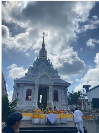
ภาพที่ 1 ศาลหลักเมืองบ้านเมืองใหม่ ตำบลเมืองใหม่ อำเภอกลาง จังหวัดภูเก็ต

กลางถูกยุบเป็นอำเภอขึ้นกับเมืองภูเก็ตหลังการเปลี่ยนแปลงการปกครอง 2475 อำเภอทุ่งคา เปลี่ยนมาเป็นอำเภอเมืองภูเก็ต และเปลี่ยนชื่ออำเภอกลางเป็นอำเภอกลางในปี พ.ศ. 2481 ซึ่งในปัจจุบันศาลหลักเมือง เมืองใหม่ก็ยังมีผู้คนให้ความสนใจในเรื่องของความเชื่อความศรัทธาและเข้ามาเคารพสักการะบูชาอยู่เสมอ