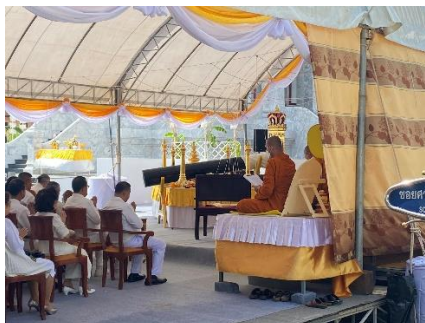
ภาพที่ 2 พิธีพุทธาภิเษกเสาหลักเมืองและตั้งเสาหลักเมืองจังหวัดภูเก็ตระหว่างวันที่ 5-7 สิงหาคม 2566 ณ ศาลหลักเมืองจังหวัดภูเก็ต(เมืองใหม่) ตำบลเทพกระษัตรี อำเภอถลาง จังหวัดภูเก็ต (ที่มา: นางสาว ศิราณี พิสิฐธาดา, 2566)

จากการศึกษาบทบาทของศาลหลักเมืองในจังหวัดภูเก็ต พ.ศ. 2370 –2391 ความเชื่อของคนในสังคมไทย ต่อศาลหลักเมืองเป็นเครื่องยึดเหนี่ยวจิตใจตามคติประเพณีเกี่ยวกับการสร้างบ้านสร้างเมืองจะต้องมีการประกอบพิธีเพื่อให้เกิดความเป็นสิริมงคลแก่บ้านเมือง พิธีดังกล่าว คือ "การยกเสาหลักเมือง" และการสร้างหลักเมืองของจังหวัดภูเก็ตเริ่มตั้งแต่หลังสงคราม พ.ศ. 2352 ที่ต้องถูกพม่าทำลายลงด้วยกำลังพลรบมหาศาลชาวกลางตกอยู่ในสภาพที่บ้านแตกสาแหรกขาด ที่เหลือตายต่างตกใจกลัวทั้งบ้านช่องหนีเข้าป่า เข้าดง บ้างก็ลงเรือพายหนีไปอยู่ตามเกาะเล็ก เกาะน้อยรอบๆ เกาะกลาง บางพวกก็หลบหนีพม่าไปทางฝั่งพังงา ทุกคนต่างก็อดอยากยากแค้นแสนเข็ญทุกข์ทรมานแสนสาหัสและ ในปี พ.ศ. 2370 พระบาทสมเด็จพระนั่งเกล้าเจ้าอยู่หัว ทรงพระราชดำริว่า จะปล่อยให้เมืองกลางทิ้งร้างไม่ได้ จึงโปรดฯ ให้ชักชวนชาวกลางโดยกำเนิด กลับมาตั้งถิ่นฐานยังบ้านเดิมที่เมืองกลาง ซึ่งก่อตั้งขึ้นใหม่เรียกว่า "กลางเมืองใหม่" โดยฝั่งหลักเมืองลงในพื้นที่ราบ อันเป็นชัยภูมิที่เหมาะสมการสร้างศาลหลักเมืองจึงมีบทบาทสำคัญในการสร้างเมืองไว้เพื่อเป็นมิ่งขวัญเป็นนิมิต-มงคลและเป็นศูนย์รวมของความมั่นคงให้แก่ชาวกลางในครั้งนั้นและกลางได้มีการพัฒนาด้านเศรษฐกิจและมีผู้คนเข้ามาทำการค้าขายตั้งแต่ในอดีตจนถึงปัจจุบันและในปัจจุบันบทบาทของศาลหลักเมือง เมืองใหม่ก็ยังมีผู้คนที่มีความเชื่อความศรัทธาเข้ามาเคารพสักการะบูชาอยู่เสมอ