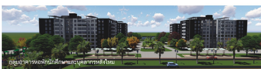
กลุ่มอาคารหอพักนักศึกษาและบุคลากรหลังใหม่