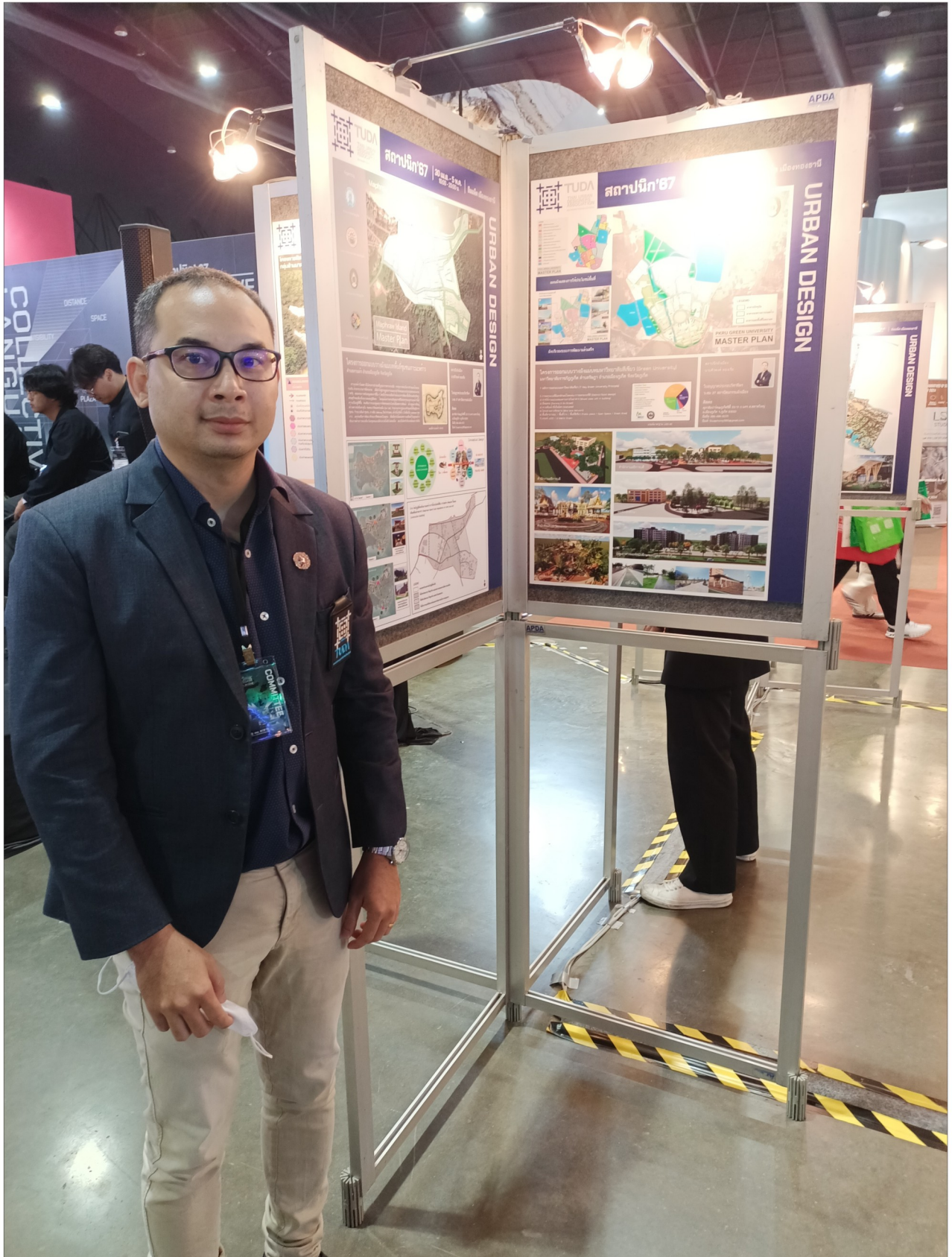
จัดแสดงและเผยแพร่ผลงานออกแบบสร้างสรรค์รูปแบบไฮสโตนอร์ในงานสถาปนิก 2567 ชื่อ “โครงการออกแบบวางผังแม่บทพื้นที่ชุมชนเกาะมะพร้าว ตำบลเกาะแก้ว อำเภอเมืองภูเก็ต จังหวัดภูเก็ต” และ “โครงการออกแบบวางผังแม่บทมหาวิทยาลัยสีเขียว (Green University) มหาวิทยาลัยราชภัฏภูเก็ต ตำบลรัชฎา อำเภอเมืองภูเก็ต จังหวัดภูเก็ต” ภายใต้หัวข้อ “Collective Language สัมผัส สถาปัตยกรรม : The 36th ASEAN's Largest Building Technology Exposition” จัดโดย สมาคมสถาปนิกสยาม ในพระบรมราชูปถัมภ์ และสมาคมสถาปนิกผังเมืองไทย ในระหว่างวันที่ 30 เมษายน – 5 พฤษภาคม พ.ศ.2567 ณ ชาเลนเจอร์ฮอลล์ 1-3 ศูนย์แสดงสินค้าและการประชุมอิมแพ็ค เมืองทองธานี กรุงเทพมหานคร