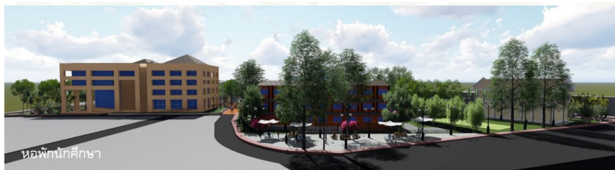
หอพักนักศึกษา