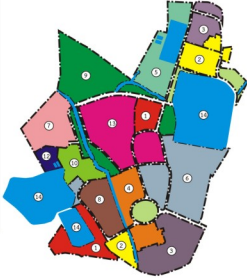
PKRU GREEN UNIVERSITY MASTER PLAN