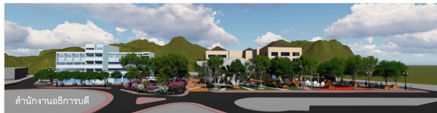
สำนักงานอธิการบดี