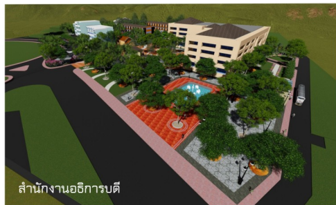
สำนักงานอธิการบดี

ใบอนุญาตประกอบวิชาชีพ ว-สผ 37 สถาปัตยกรรมผังเมือง ติดต่อ ศุภาสัยปาร์คภูเก็ตซีดี 33/31 ถนน ต.ตลาดใหญ่ อ.เมืองภูเก็ต จ.ภูเก็ต 83000 มือถือ 099-496-9225 อีเมลล์ Siwaphong1985@gmail.com