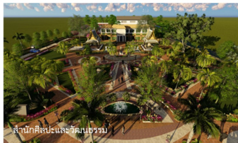
สำนักศิลปะและวัฒนธรรม