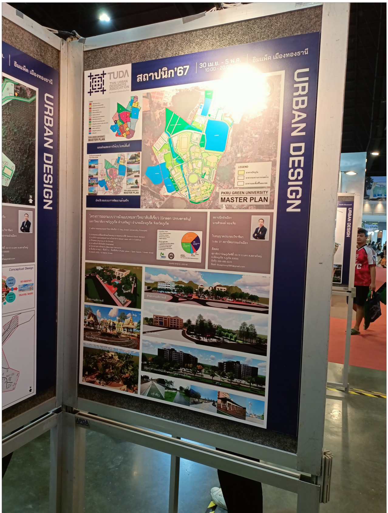
จัดแสดงและเผยแพร่ผลงานออกแบบสร้างสรรค์รูปแบบโปสเตอร์ในงานสถาปนิก 2567 ชื่อ “โครงการออกแบบวางผังแม่บทมหาวิทยาลัยสีเขียว (Green University) มหาวิทยาลัยราชภัฏภูเก็ต ตำบลรัษฎา อำเภอเมืองภูเก็ต จังหวัดภูเก็ต” ภายใต้หัวข้อ “Collective Language สัมผัส สถาปัตยกรรม : The 36th ASEAN's Largest Building Technology Exposition” จัดโดย สมาคมสถาปนิกสยาม ในพระบรมราชูปถัมภ์ และสมาคมสถาปนิกผังเมืองไทย ในระหว่างวันที่ 30 เมษายน – 5 พฤษภาคม พ.ศ.2567 ณ ชาเลนเจอร์ฮอลล์ 1-3 ศูนย์แสดงสินค้าและการประชุมอิมแพ็ค เมืองทองธานี กรุงเทพมหานคร