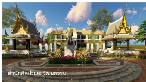
สำนักศิลปะและวัฒนธรรม