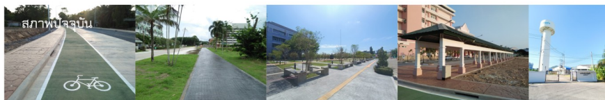
สภาพปัจจุบัน