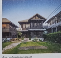
บ้านนาเย็น กรุงเทพมหานคร