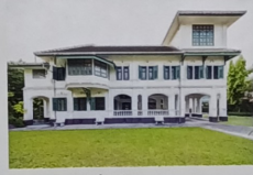
บ้านเจ้าพระยาธรรมศักดิ์มนตรี กรุงเทพมหานคร