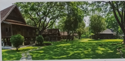
พิชิตกานธีเรือนโบราณล้านนา สำนักสงฆ์ธรรมวิปัสสนาธรรม มหาวิทยาลัยเชียงใหม่ จังหวัดเชียงใหม่