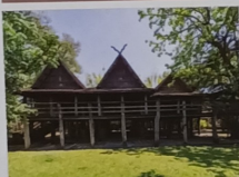
เรือนสยาม-สยาม ศูนย์วัฒนธรรมเชียงใหม่ จังหวัดเชียงใหม่