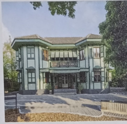
ไถบ้าน กรุงเทพมหานคร