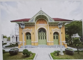
วิทยาลัย ภาณุในฐานะหอ วิทยาลัยศิลปศึกษาโบราณ กรุงเทพมหานคร