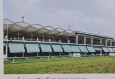
อาคารสิริราชธานี กรุงเทพมหานคร