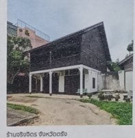
บ้านวงศ์จิว กรุงเทพมหานคร