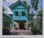
บ้านนาเย็น จังหวัดภูเก็ต