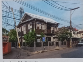
บ้านสยาม-บ้าน 11 กรุงเทพมหานคร