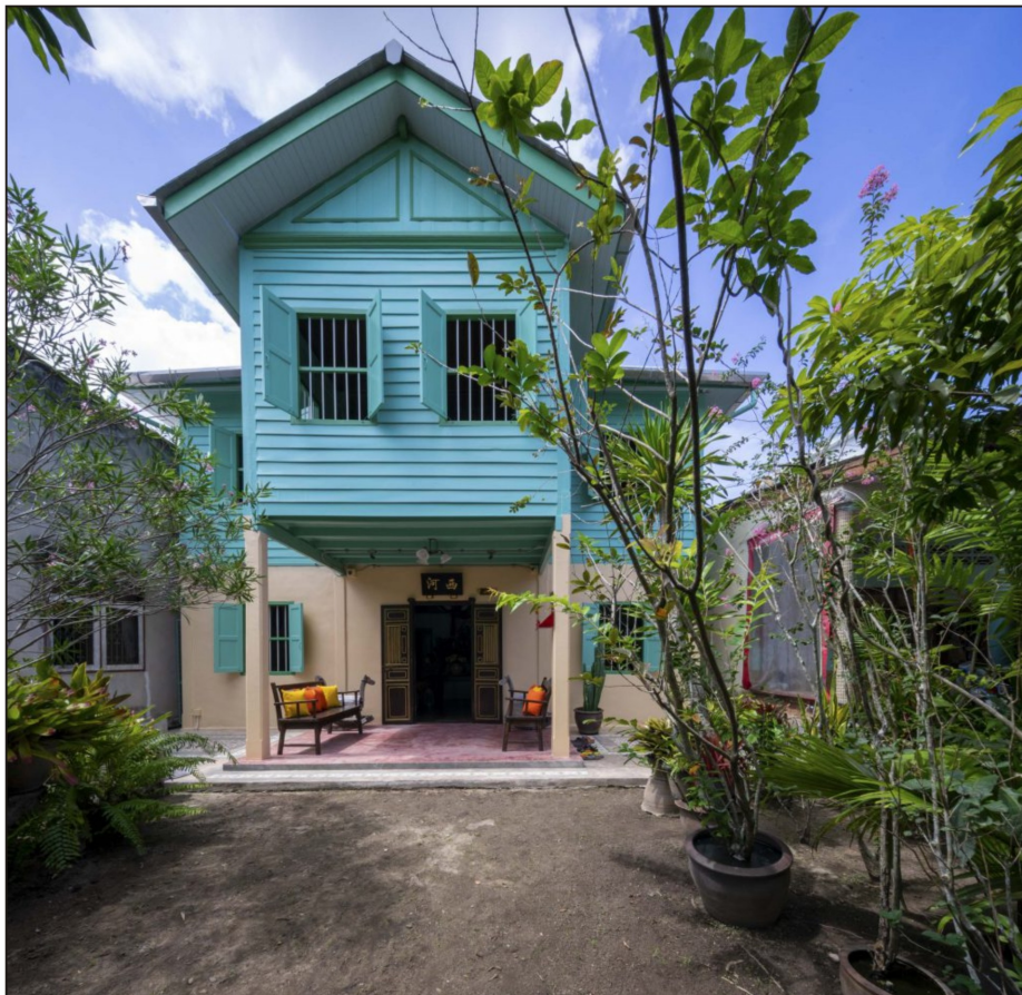
สมาคมสถาปนิกสยามฯ สํารวจพื้นที่และถ่ายภาพ “บ้านยื่นเต่ง” (23 มีนาคม พ.ศ.2565)

บ้านยื่นเต่งเป็นอาคารอังก่อทลาว (บ้านทรงฝรั่งแบบชิโนยูโรเปียนของชาวจีนฮกเกี้ยน) ที่ยังคงเหลืออยู่ในอำเภอกระทุ้ง จังหวัดภูเก็ต จึงมีคุณค่าทางประวัติศาสตร์ท้องถิ่นที่แสดงให้เห็นถึงพัฒนาการทางเศรษฐกิจและสังคมของชุมชน การอนุรักษ์บ้านหลังนี้แสดงให้เห็นถึงความตั้งใจของผู้ครอบครองอาคารในการรักษาสภาพเดิมของอาคารไว้ พื้นที่ภายในแสดงการอยู่อาศัยแบบเดิมผสมผสานการใช้งานใหม่ในการเป็นพิพิธภัณฑ์ท้องถิ่นได้ค่อนข้างดี อย่างไรก็ตาม ควรพิจารณาเรื่องการดูแลรักษาบรรยากาศของสภาพโดยรอบ การซ่อมแซม การใช้วัสดุทดแทน เช่น วัสดุผนังหลังคา รวมถึงการใส่องค์ประกอบทางสถาปัตยกรรมใหม่แทนองค์ประกอบเดิม ที่จะไม่ทำให้องค์ประกอบเดิมเสียความสมบูรณ์