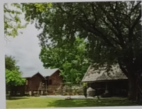
เรือนรัตนโกสินทร์ จังหวัดนครราชสีมา