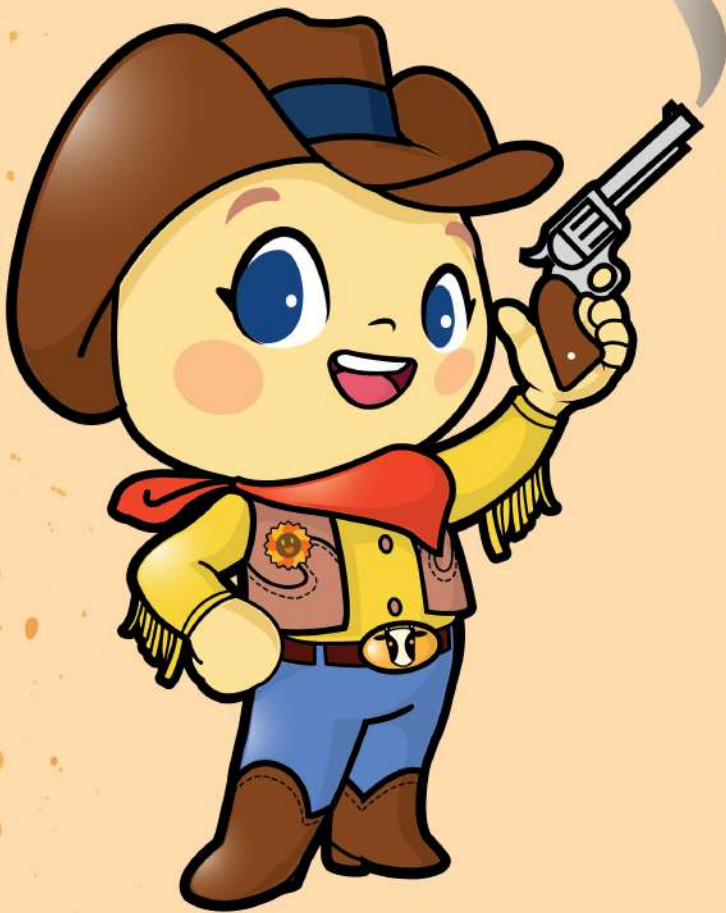
ด้านหน้า