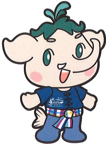
ภาพมาสคอตที่ออกแบบ

ภาพประกอบการนำผลงานวิจัยไปใช้ประโยชน์ (3-5 รูป) หรือหลักฐานในการนำผลงานวิจัยไปใช้ในการอ้างอิง