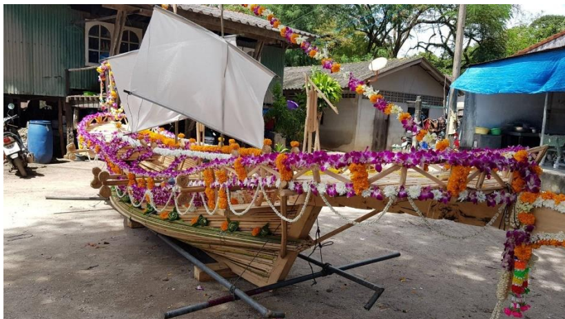
(ก) เรือปาจ๊าก

1.2 ลงพื้นที่และสัมภาษณ์เชิงลึกจากผู้รู้ในชุมชนหมู่บ้านแหลมตึกแก ตำบลเกาะสิเหร่ จังหวัดภูเก็ตพบว่า มีวิถีชีวิต ประเพณี และภูมิปัญญาท้องถิ่น ที่เป็นเอกลักษณ์อย่างเด่นชัด เช่น ประเพณีลอยเรือ การทำบุญ (ไซจับปลาของชาวเล) ดังแสดงในภาพที่ 2 เพื่อนำมาออกแบบกิจกรรมและพัฒนาเป็นแผนการจัดประสบการณ์การเรียนรู้พหุวัฒนธรรมศึกษาวิถีเกาะสิเหร่ โดยมีเนื้อหาเกี่ยวกับ วิถีชีวิต ประเพณี และ ภูมิปัญญาท้องถิ่น เนื้อหาละ 3 หน่วยการเรียนรู้ รวมทั้งหมด 9 หน่วยการเรียนรู้ ดังแสดงในตารางที่ 1 พร้อมกับคู่มือประกอบการใช้งานแผนการจัดการเรียนรู้