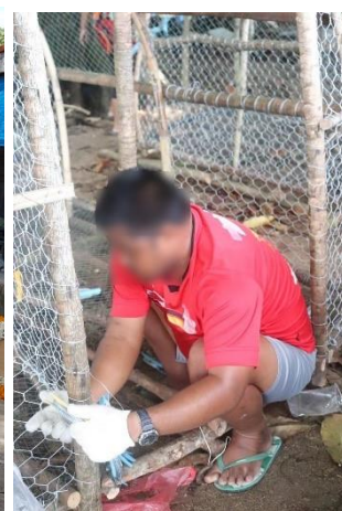
(ข) การทำบุญ (ไซ) ของชาวเล