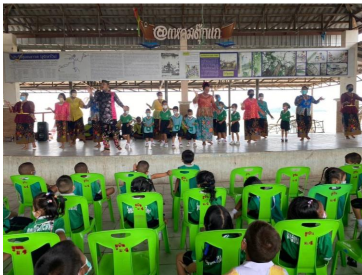
ภาพที่ 3 ลงพื้นที่เรียนรู้วิถีชีวิต ประเพณี และภูมิปัญญาท้องถิ่น

3. ประเมินสมรรถนะเชิงวัฒนธรรมของเด็กปฐมวัยหลังการจัดประสบการณ์การเรียนรู้พหุวัฒนธรรมศึกษาวิถีเกาะสิเหร่ ด้วยแบบวัดสมรรถนะเชิงวัฒนธรรมในเด็กปฐมวัยที่ผู้วิจัยสร้างขึ้น ในสัปดาห์ที่ 11