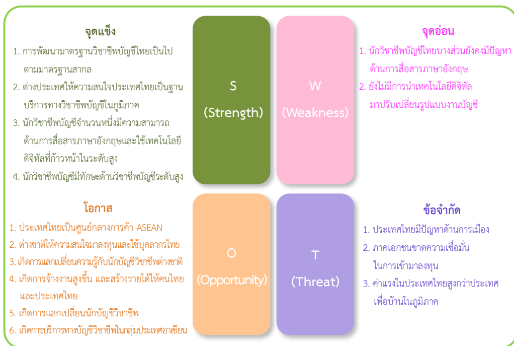
ภาพ 2 สาระสำคัญทางสภาพแวดล้อมและศักยภาพของผู้ประกอบวิชาชีพการบัญชีไทย

ทั้งนี้ ผู้เขียนได้นำมาสังเคราะห์สรุปสาระสำคัญ แสดงดังภาพ 2