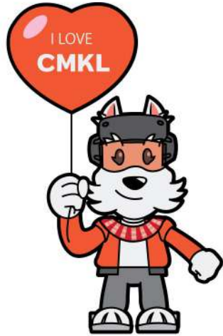
ทำถือลูกโป่ง