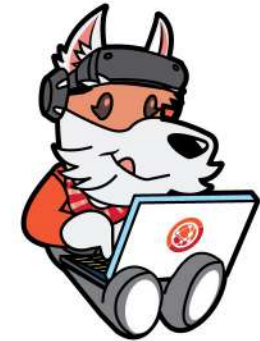
ทำเรียนออนไลน์