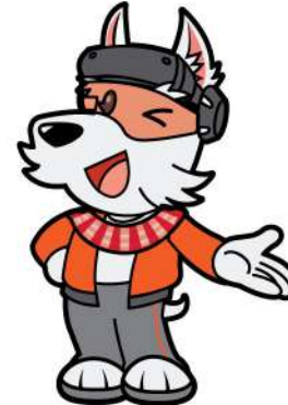
ทำเชื่อเชิญ