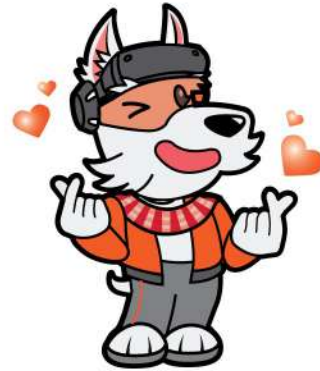
ทำมีนิ ฮาร์ท