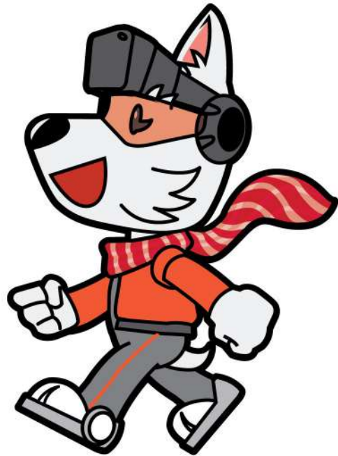
Side View (Right)