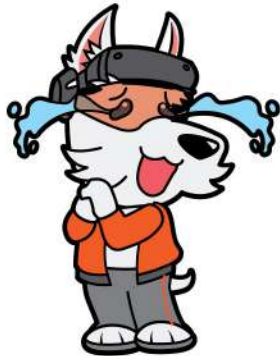
ทำปลานปลื้ม