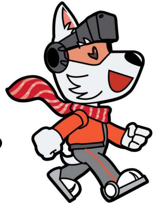
Side View (left)