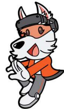
ทำโพสท่า ๆ