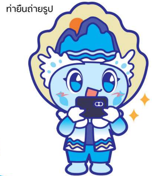
ทำยื่นถ่ายรูป