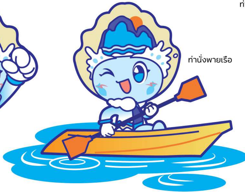
ทำนั่งพายเรือ