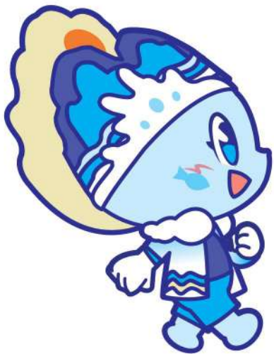
Side View (Right)