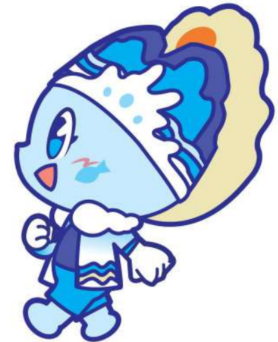
Side View (left)