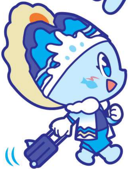
ทำเดินลากกระเป๋า