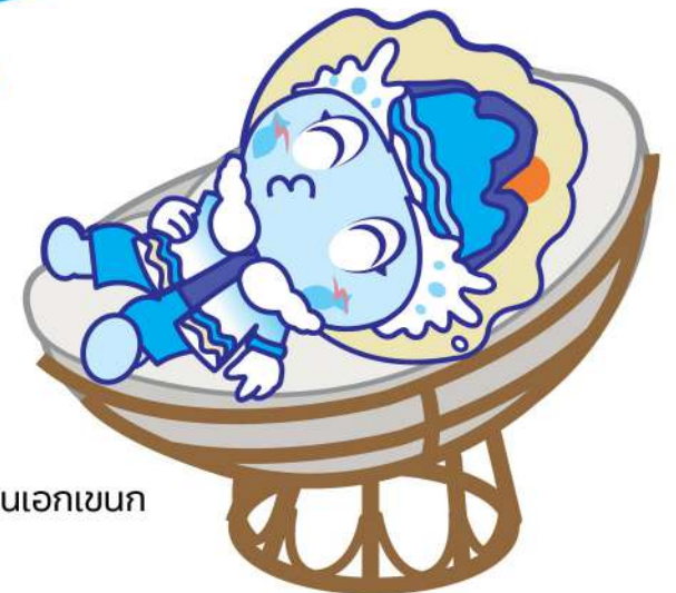
ทำนอนเอกเขนก