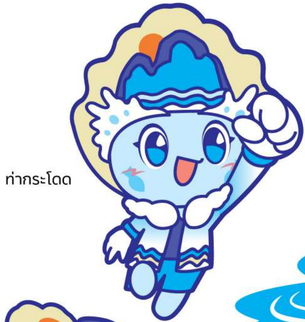
ทำกระโดด