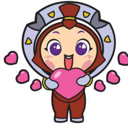
ทำเลิฟ เลิฟ