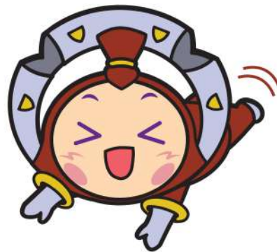
ทำนอนคว่ำ