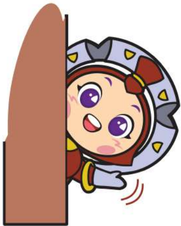
ทำจ๊ะเอ๋