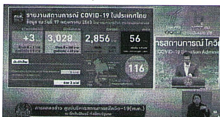
ภาพที่ 1 การนำเสนอข้อมูลในรูปแบบสถิติ

6.1 ข้อมูลในรูปแบบสถิติ คือ การนำเสนอข้อมูลที่รวบรวมเอาไว้เป็นตัวเลขสำหรับใช้เปรียบเทียบ หรืออ้างอิง เพื่อเป็นเครื่องมือช่วยในการตัดสินใจอย่างมีเหตุผล ดังภาพตัวอย่าง