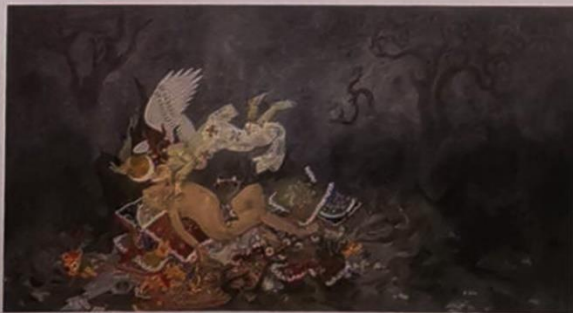
Suvicha Phungkate "The Light of Life Power No.4" Digital painting, charcoal and acrylic 129 x 255.5 cm