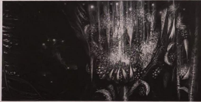
สุวิชา พึ่งภค "แสงแห่งพลังชีวิต หมายเลข 4" จิตรกรรมสีดิจิทัลผสม ชาติโคล และอะครีลิก 129 x 255.5 ซม.