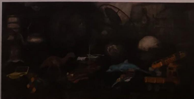
Supatchar Rojanavamij "Tragic Romance No.1" Watercolor, tempera and gold leaves on paper 46.5 x 74 cm