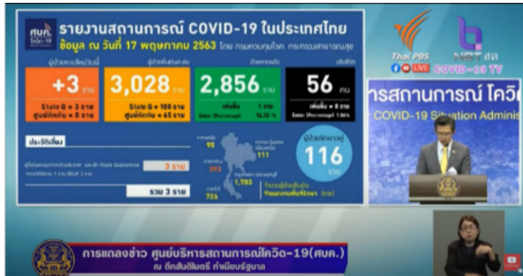
ที่มา: วันที่ 17 พฤษภาคม 2563

2.4.2 การนำเสนอข้อมูลในรูปแบบกราฟ คือ การนำเสนอข้อมูลโดยใช้เส้น จุด หรือภาพ ประกอบการอธิบาย เพื่อให้ผู้ฟังเข้าใจง่าย เพราะการนำเสนอข้อมูลแบบนี้เป็นการ