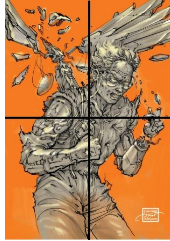
ภาพที่ 10 การวิเคราะห์ดุลยภาพ

4.2.2 วิเคราะห์ดุลยภาพ (Balance) ดุลยภาพของภาพเป็นแบบอสมมาตร ซ้ายขวาสองข้างไม่เท่ากัน (Asymmetrical Balance) (ภาพที่ 10)