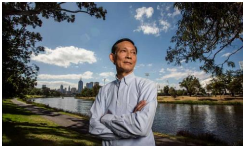
ภาพที่ 3 ภาพถ่ายพล.ต.ต.ปวีณ พงศ์สิรินทร์ อดีตรองผู้บัญชาการตำรวจภูธรภาค 8

1. สืบค้นหาภาพของตำรวจที่เป็นแรงบันดาลใจในการสร้างสรรค์ผลงาน เพื่อใช้เป็นแนวทางในการสร้างสรรค์ ซึ่งในที่นี้ ผู้สร้างสรรค์ได้เลือกภาพของนายตำรวจไทยที่มีผลงานที่โดดเด่นและมีลักษณะใบหน้าที่มีความเฉพาะตัว เพื่อใช้ประกอบเป็นข้อมูลอ้างอิง (Reference) ในการทำงาน (ภาพที่ 1)