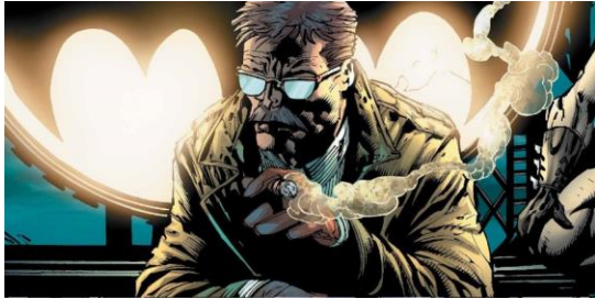
ภาพที่ 1 เจมส์ กอร์ดอน (JAMES GORDON)

อาชญากรรมของเมือง Gotham City แต่ร้อยโทบูลล็อค เขาได้ซึมซับความจริงใจและความศรัทธาในการอาชีพ ตำรวจจากเจมส์ กอร์ดอน เขาเกือบถูกฆ่าตายในตอน "No Man's Land" จากนั้นเขาก็ถูกปลดออกจากการ์ตูน เรื่อง "Gotham Central" และถูกนำกลับมาหลังจาก "Infinite Crisis"