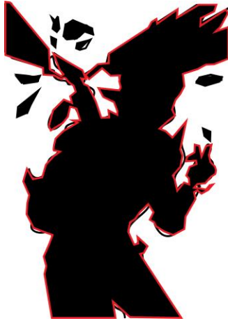
ภาพที่ 7 การวิเคราะห์พื้นที่ว่าง

4.1.3 วิเคราะห์สี (Color) ใช้สีโทนอุ่น (Warm Tone) ภายในรูปทรงจะเลือกใช้สีเทา สีเทาอมส้ม 4 น้ำหนัก โดยรอบรูปทรงจะตัดเส้นด้วยสีดำ พื้นหลังจะใช้สีส้ม (ภาพที่ 8)