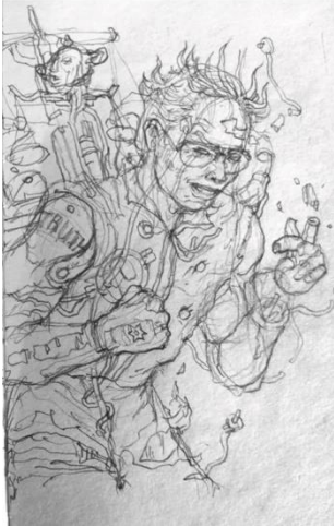
ภาพที่ 5 วาดด้วยดินสอ