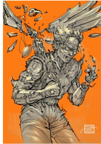
ภาพที่ 6 วาดด้วยโปรแกรมคอมพิวเตอร์

4. นำภาพร่างไปวาดในคอมพิวเตอร์ ใช้วิธีการถ่ายภาพและนำไปเปิดทำงานในโปรแกรม Clip Studio โดยนำภาพร่างที่ถ่ายภาพเอาไว้ใช้เป็นภาพต้นแบบ จะสร้างเลเยอร์ที่อยู่ด้านล่างสุดและล็อก (Lock) เอาไว้