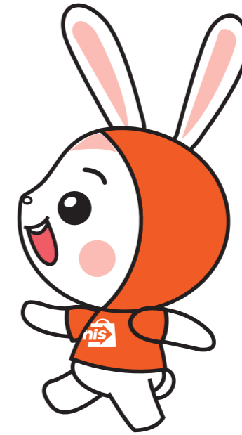
ด้านข้าง