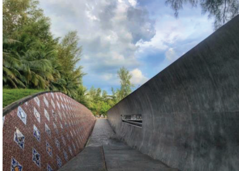
ภาพที่ 1 สวนอนุสรณ์สึนามิบ้านน้ำเค็ม ที่มา : ถ่ายเมื่อ 30 มกราคม 2564

6.3 ท่าเทียบเรือบ้านน้ำเค็ม เป็นท่าเรือที่ใช้บริการข้ามฟากไปยังเกาะคอเขาทั้งรถยนต์และรถจักรยานยนต์ ค่าบริการรถยนต์ 150 บาท และรถจักรยานยนต์ 20 บาท ใช้เวลาประมาณ 10 นาที