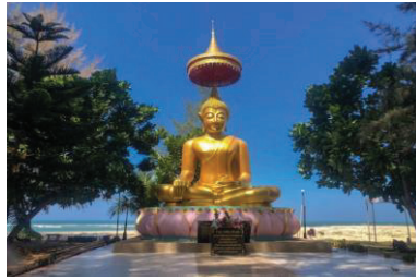
ภาพที่ 6 องค์พระพุทธรูปนั่งปางลอย

6.8 วัดแหลมป้อม หรือเรียกว่า วัดน้ำเค็ม ชื่อวัดแหลมป้อมเป็นชื่อที่ใช้จดทะเบียนชื่อของวัด แต่ประชากรในชุมชนจะเรียกว่า วัดน้ำเค็ม สำหรับวัดแหลมป้อมเป็นวัดที่ชาวบ้านน้ำเค็มทั้งชาวไทยและชาวมอญแกนใช้ยึดเหนี่ยวจิตใจ และนิยมมาทำบุญกันโดยเฉพาะในช่วงเทศกาลต่าง ๆ วัดแหลมป้อมยังเป็นที่หลบภัยสึนามิ โดยประชากรจะมาอยู่วัดเป็นจำนวนมากในเวลาคับขัน หรือมีสัญญาณเตือนภัยดัง เนื่องจากทำเลที่ตั้งของวัดอยู่ในพื้นที่สูง