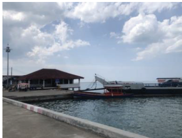
ภาพที่ 4 สะพานท่าเทียบเรือบ้านน้ำเค็ม

6.5 สะพานท่าเทียบเรือบ้านน้ำเค็ม เป็นสะพานที่ใช้สำหรับตักปลาในตอนเย็น เด็ก ๆ ในชุมชนมักรวมตัวกันเพื่อเล่นน้ำทะเล สะพานท่าเทียบเรือบ้านน้ำเค็มเป็นสะพานที่นักท่องเที่ยวนิยมถ่ายรูปในตอนเย็นขณะที่พระอาทิตย์กำลังตก ซึ่งมองไปทางฝั่งตรงข้ามจะเห็นฝั่งเกาะคอเขา