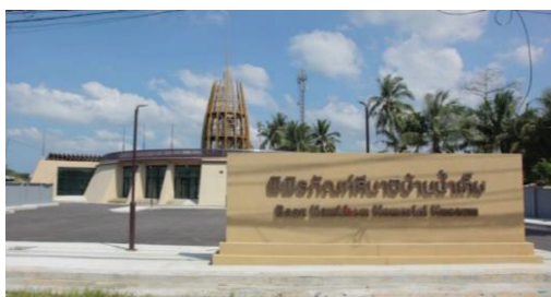
ภาพที่ 3 พิพิธภัณฑ์สึนามิบ้านน้ำเค็ม

6.4 พิพิธภัณฑ์สึนามิบ้านน้ำเค็ม เป็นอนุสรณ์สถานและพิพิธภัณฑ์ เกิดจากผู้ประสบภัยเหตุการณ์ภัยพิบัติคลื่นยักษ์สึนามิร่วมกันคิดบันทึกเรื่องราวชุมชนหลังถูกคลื่นยักษ์สึนามิทำลายหมู่บ้านน้ำเค็ม นำมาสู่การจัดทำเป็นแหล่งเรียนรู้การเกิดปรากฏการณ์เหตุการณ์ภัยพิบัติคลื่นยักษ์สึนามิ เพื่อให้เกิดความเข้าใจเมื่อเกิดสถานการณ์และการหลบหนีคลื่นยักษ์สึนามิ รวมทั้งเป็นแหล่งเก็บรวบรวมข้อมูลสำคัญช่วงที่เกิดเหตุการณ์ภัยพิบัติคลื่นยักษ์สึนามิ ใน พ.ศ.2547