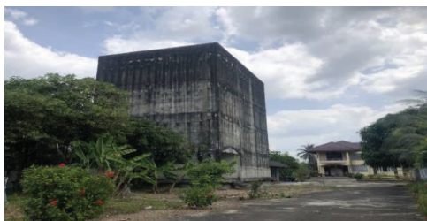
ภาพที่ 8 ตึกรังนกนางแอ่น

6.9 ตึกรังนกนางแอ่น เป็นตึกไม่มีหน้าต่างมีเพียงช่องเล็ก ๆ ไว้สำหรับนกนางแอ่นทำรัง และเก็บเกี่ยวผลผลิตจากรังนกนางแอ่นขาย ซึ่งมีราคาสูง