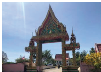
ภาพที่ 7 วัดแหลมป้อม

6.8 วัดแหลมป้อม หรือเรียกว่า วัดน้ำเค็ม ชื่อวัดแหลมป้อมเป็นชื่อที่ใช้จดทะเบียนชื่อของวัด แต่ประชากรในชุมชนจะเรียกว่า วัดน้ำเค็ม สำหรับวัดแหลมป้อมเป็นวัดที่ชาวบ้านน้ำเค็มทั้งชาวไทยและชาวมอญแกนใช้ยึดเหนี่ยวจิตใจ และนิยมมาทำบุญกันโดยเฉพาะในช่วงเทศกาลต่าง ๆ วัดแหลมป้อมยังเป็นที่หลบภัยสึนามิ โดยประชากรจะมาอยู่วัดเป็นจำนวนมากในเวลาคับขัน หรือมีสัญญาณเตือนภัยดัง เนื่องจากทำเลที่ตั้งของวัดอยู่ในพื้นที่สูง