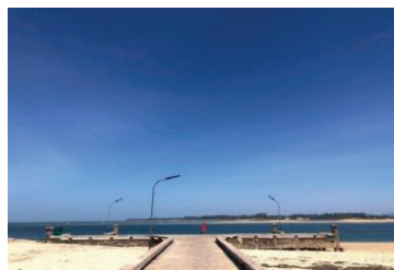
ภาพที่ 2 ท่าเรือบ้านน้ำเค็ม ที่มา : ถ่ายเมื่อ 30 มกราคม 2564

6.3 ท่าเทียบเรือบ้านน้ำเค็ม เป็นท่าเรือที่ใช้บริการข้ามฟากไปยังเกาะคอเขาทั้งรถยนต์และรถจักรยานยนต์ ค่าบริการรถยนต์ 150 บาท และรถจักรยานยนต์ 20 บาท ใช้เวลาประมาณ 10 นาที