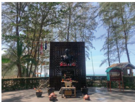
ภาพที่ 5 กรมหลวงชุมพรเขตอุดมศักดิ์

6.6 กรมหลวงชุมพร พระเจ้าบรมวงศ์เธอกรมหลวงชุมพรเขตอุดมศักดิ์ หรือพระเจ้าลูกยาเธอ พระองค์เจ้าอาภากรเกียรติวงศ์ ทรงเป็นต้นราชสกุล “อาภากร” เป็นพระราชโอรสในพระบาทสมเด็จพระจุลจอมเกล้าเจ้าอยู่หัว (ร.5) พระองค์ทรงได้รับสมัญญานามว่า องค์บิดาของทหารเรือไทย พระรูปของกรมหลวงชุมพรเขตอุดมศักดิ์ ตั้งอยู่สวนอนุสรณ์สินามิบ้านน้ำเค็ม