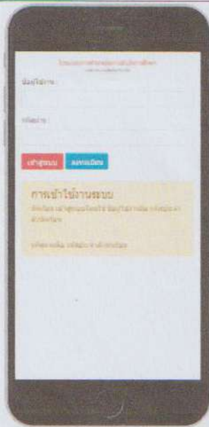
ภาพที่ 1 หน้าหลักโปรแกรมการดำเนินงานผลการสำเร็จการศึกษา

หลักฐาน/ภาพประกอบการนำผลงานวิจัยไปใช้ประโยชน์ (3-5 รูป) หรือหลักฐานในการนำผลงานวิจัยไปใช้ในการอ้างอิง