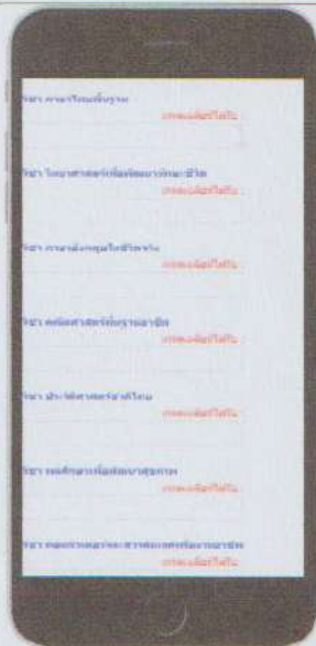
ภาพที่ 3 หน้ากรอกข้อมูลผลการเรียน