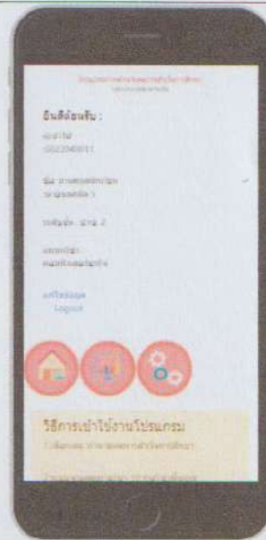
ภาพที่ 2 หน้าเข้าสู่โปรแกรม