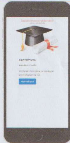
ภาพที่ 4 หน้าผลการทำนาย นักเรียนสำเร็จการศึกษา