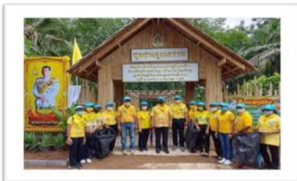
ภาพประกอบที่ 5 ภาพศูนย์เรียนรู้เศรษฐกิจพอเพียงชุมชนคุณธรรมวัดกาญจนบุรีรักษ์