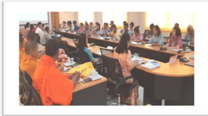
ภาพประกอบที่ 3 เวทีประชาคมก่อตั้งชุมชนคุณธรรมฯ วัดกาญจนปริวรรค์ (บ้านโคกแค)