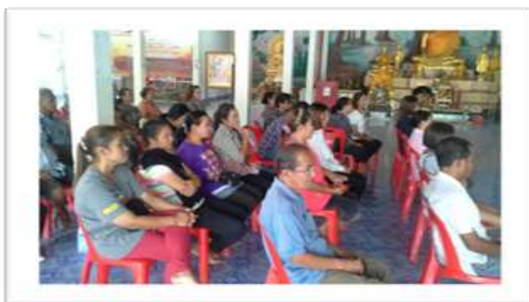
ภาพประกอบที่ 1 ภาพการประชุมจัดทำแผนการปฏิบัติงานชุมชนคุณธรรมวัดกาญจนบุรีริกษ์

การดำเนินงานการขับเคลื่อนโครงการมุ่งเน้นกระบวนการมีส่วนร่วมของประชาชน หน่วยงาน และองค์กรต่างๆในชุมชน ซึ่งชุมชนได้ทำการกำหนดเป้าหมายร่วมกัน คือ "ประชาชน รู้สามัคคี มีการพัฒนา อาชีพก้าวหน้า ตามหลักปรัชญาของเศรษฐกิจพอเพียง"แนวทางการพัฒนานำสู่ความสำเร็จ โดยมีวัตถุประสงค์ คือ ส่งเสริมกระบวนการมีส่วนร่วม ในการพัฒนาหมู่บ้าน สิ่งแวดล้อม สาธารณะประโยชน์ สืบสานวัฒนธรรมประเพณีท้องถิ่น ส่งเสริมการพัฒนาอาชีพหลักเกษตรกรรมตามแนวปรัชญาของเศรษฐกิจพอเพียง เพื่อลดต้นทุน การเพิ่มผลผลิตอย่างมีคุณภาพสนับสนุนการสืบทอดภูมิปัญญาท้องถิ่น ส่งเสริมการประกอบอาชีพเสริมและส่งเสริมการประยุกต์ใช้หลักปรัชญาเศรษฐกิจพอเพียงในการดำเนินชีวิต โดยจัดกิจกรรมขับเคลื่อนโครงการฯให้บรรลุเป้าหมายตามวัตถุประสงค์ที่ร่วมกันวางไว้ และจัดทำแผนส่งเสริมคุณธรรม ร่วมกันจัดตั้งศูนย์เรียนรู้วิถีพอเพียงชุมชนคุณธรรมวัดกาญจนบุรีริกษ์ (บ้านโคกแค) จัดตั้งกลุ่มจิตอาสาทำความสะอาดบริเวณสาธารณะของหมู่บ้าน จัดตั้งกลุ่มออมทรัพย์ชุมชนคุณธรรมฯวัดกาญจนบุรีริกษ์ จัดทำบัญชีครัวเรือน จัดโครงการรณรงค์ประชาสัมพันธ์การกำจัดขยะในครัวเรือน จัดกิจกรรมส่งเสริมหลักธรรมทางศาสนา หลักปรัชญาของเศรษฐกิจพอเพียง และมีการติดตามประเมินผลสำเร็จ ทบทวน ปรับปรุงแผนส่งเสริมคุณธรรมของชุมชนให้มีคุณภาพและบรรลุผล รวมทั้งมีการประกาศยกย่องเชิดชูบุคคลผู้ทำความดีหรือบุคคลผู้มีคุณธรรมในชุมชนหรือบุคคลอื่นที่ทำความดีให้กับชุมชน