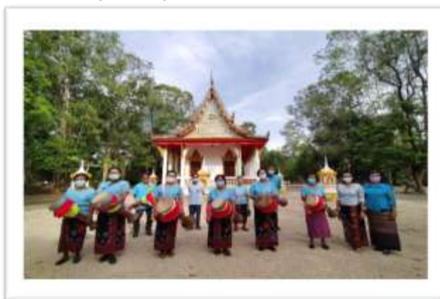
ภาพประกอบที่ 6 ภาพการกลุ่มผู้สูงชุมชนคุณธรรมวัดกาญจนบุรีรักษ์ในชุดการแสดงลำกลองยาว

4.2 ผลจากการศึกษาวิจัยเกี่ยวกับกระบวนการมีส่วนร่วมของชุมชนในการขับเคลื่อนโครงการชุมชนคุณธรรมน้อมนำปรัชญาเศรษฐกิจพอเพียง วัดกาญจนบุรีรักษ์ ตำบลเขาขาว อำเภอห้วยยอด จังหวัดตรัง พบว่ากระบวนการมีส่วนร่วมของชุมชนในการขับเคลื่อนโครงการชุมชนคุณธรรมฯ ประกอบด้วย 1. ผู้นำและประชาชนในชุมชนมีส่วนร่วมกับการตัดสินใจแก้ไขปัญหาของชุมชนโดยการจัดเวทีประชาคม พร้อมกำหนดเป้าหมายการพัฒนาชุมชนคุณธรรมฯ ประกาศเจตนารมณ์หรือข้อตกลงของชุมชนร่วมกัน 2. ชุมชนมีส่วนร่วมในการวางแผนดำเนินงานและ ดำเนินการโครงการจากคณะกรรมการชุมชนคุณธรรมฯวัดกาญจนบุรีรักษ์ ประชาชนร่วมกันจัดทำแผนส่งเสริมคุณธรรมของชุมชนวัดกาญจนบุรีรักษ์ 3. ชุมชนมีส่วนร่วมในการประเมินผลโครงการชุมชนคุณธรรม อย่างต่อเนื่องเพื่อปรับปรุงแผนส่งเสริมคุณธรรมให้มีคุณภาพและพัฒนาให้ดีขึ้น ซึ่งชุมชนมีข้อปฏิบัติของหมู่บ้าน มีระเบียบข้อบังคับข้อปฏิบัติเป็นลายลักษณ์อักษร คราวเรือนในหมู่บ้านปฏิบัติตามข้อปฏิบัติอย่างเคร่งครัดและ 4. ชุมชนมีส่วนร่วมในการรับผลประโยชน์ จากผลลัพธ์ของการดำเนินการชุมชนได้ทำการขยายผลกิจกรรมใน 3 มิติ ประกอบด้วย กิจกรรมส่งเสริมหลักธรรมทางศาสนา หลักปรัชญาของเศรษฐกิจพอเพียง วิถีวัฒนธรรมที่ดีงาม และเป็นแหล่งแลกเปลี่ยนเรียนรู้ ถ่ายทอดให้กับชุมชนอื่น ๆ พร้อมทั้งมอบรางวัลให้เป็นขวัญและกำลังใจให้กับสมาชิก