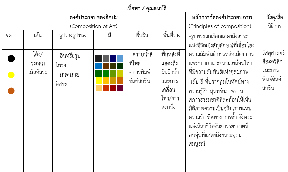
ตารางที่ 3 แสดงองค์ประกอบของศิลปะและหลักการจัดองค์ประกอบภาพ