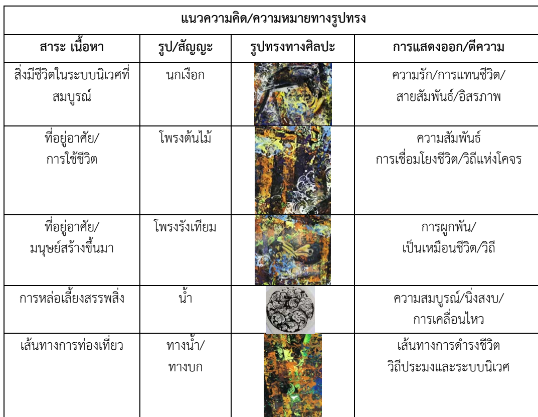
ตารางที่ 1 แนวความคิด/ความหมายทางรูปทรง

การสร้างสรรค์ด้วยแบบภาพร่าง รูปทรง รูปร่างได้แสดงเนื้อหาถ่ายทอดความหมายในตัวผลงาน เนื้อหาภายใน ภายนอกแสดงออกผ่านรูปทรงทางสัญลักษณ์ที่แทนความหมายผสมผสานภาพประทับใจ ภาพแทนความหมาย “ภาพ ประทับใจแห่งความสัมพันธ์บนผืนเกาะยวน้อย” ผ่านเนื้อหา เรื่องราว สาระ รูปทรง เพื่อให้เข้าใจความหมายทางสัญลักษณ์ต่อ การวิเคราะห์ข้อมูล ผู้สร้างสรรค์นำเสนอด้วยรายละเอียดที่ปรากฏตามตารางที่ 1 ดังนี้