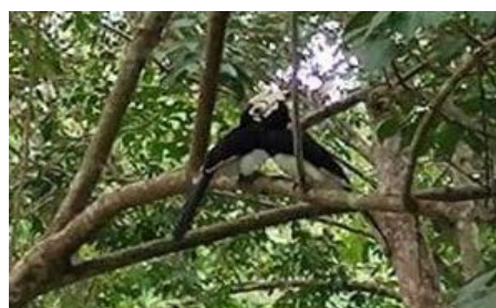
ภาพที่ 2 วิธีตามธรรมชาติ

1.2 การเก็บข้อมูลโดยการบันทึกภาพร่างหรือลายเส้น นำข้อมูลจากการลงพื้นที่ที่พบเห็นเชิงรูปธรรมมาแปร ถอดรูปสัญลักษณ์ทางรูปทรงด้านเนื้อหา เรื่องราว สู่แนวคิดที่สอดคล้องกับประเด็นการศึกษา ด้วยการทำแบบภาพร่างรูปทรงจาก ภาพความจริง นำไปสู่การถอดภาพ ความรู้สึกในการสร้างสรรค์ผลงานจิตรกรรมภายใต้เรื่องราว “ความสัมพันธ์ต่อการดำรง อยู่ตามวิถีแห่งความอุดมสมบูรณ์บนเกาะยาวน้อย” เป็นกลไกที่สร้างขึ้นเพื่อเป็นวัฏจักรความสมดุลธรรมชาติ จากการเก็บ ข้อมูลพบว่า ระบบนิเวศธรรมชาติบนพื้นที่เกาะกลางทะเล ประกอบไปด้วยรูปทรงต่าง ๆ ตามชนิดของนานาพรรณพืช นก เงือก หรือนกแก๊ก ซึ่งเป็นส่วนประกอบแห่งความสมดุลทางธรรมชาติของสรรพสิ่ง ทำให้ผู้สร้างสรรค์เกิดแนวคิด มโนภาพ และ นำรูปแบบที่ได้จากภาพร่าง รูปร่าง รูปทรงตามภาพความรู้สึกตามจินตนาการ จากการรับรู้โดยใช้ประสบการณ์ทางตรง และทางอ้อมที่ได้สัมผัส แสดงออกด้วยรูปทรงผ่านกระบวนการ ขั้นตอนต่าง ๆ และวิธีการแสดงออกในรูปแบบของจิตรกรรม โดยยึดหลักองค์ประกอบศิลป์ และทัศนธาตุทางศิลปะ