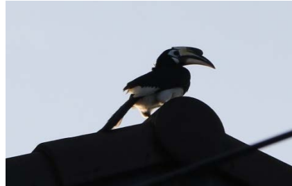
ภาพที่ 1 วิธีนกเงือก