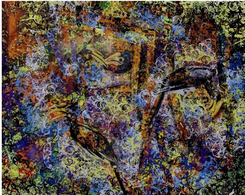
ภาพที่ 4 ภาพผลงานสำเร็จ

3. เทคนิค ผลงานสร้างสรรค์ชุดนี้ สื่อความหมายเชิงสัญลักษณ์ระบบเชิงนิเวศวัฒนธรรม/ธรรมชาติ และรูปทรงทางศิลปะ ผ่านกระบวนการเทคนิค วิธีการที่ทับซ้อน ด้วยวัสดุศาสตร์ การพิมพ์ซิลค์สกรีนหนึ่งสี สองสี และสามสี มาปรับประยุกต์ใช้สู่ผลงานศิลปะ ภาษาภาพทางทัศนศิลป์เป็นรูปธรรมก่อให้เกิดแนวคิดทางอุดมคติ และเพื่อเป็นประโยชน์กับการศึกษาค้นคว้า และนำไปประยุกต์ต่อการพัฒนาองค์ความรู้ใน การสร้างสรรค์ทางทัศนศิลป์ที่มีคุณค่าทางสุนทรีย์ะ โดยผ่านผลงานจิตรกรรม