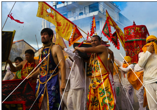
ภาพที่ 3 ความศรัทธาต่อองค์เทพกิ้ว่องไตเต้ ปีทมาสน์ พิณนุกูล (2562)

ในขณะที่ขบวนองค์เทพกิ้ว่องไตเต้เสด็จผ่าน ทุกคนต้อง “กุ่ม” หรือการนั่งคุกเข่าลง พร้อมกับพนมมือไหว้เพื่อแสดงความเคารพ ต่อองค์เทพกิ้ว่องไตเต้ด้วยความศรัทธา ซึ่งการถ่ายภาพในลักษณะมุมมอง (Viewpoint) มุมเงย (Ant’s-Eye View) หรือมุมที่เสยขึ้นด้านบนช่วย