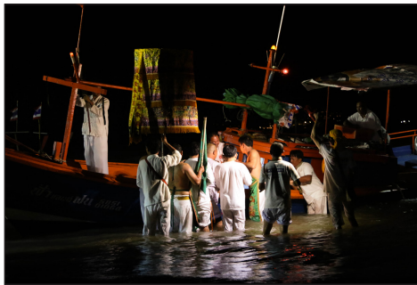
ภาพที่ 7 ส่งองค์เทพกิ้วอ่องไตเต่

เมื่อขบวนแห่ของแต่ละศาลเจ้าถึงแหลมสะพานหินพร้อมหม้อดินทั้ง 3 ชุด นำไปประกอบพิธีที่ปะรำพิธีที่ได้จัดเตรียมไว้เสมียนศาลเจ้าทำการสวดมนต์และอ่านสาส์นส่งเสด็จ บรรดาผู้คนที่จับจองพื้นที่ ณ ลานพิธีกรรมต่างจุดเทียน เพื่อน้อมส่งองค์เทพกิ้วอ่องไตเต่ด้วยการอธิษฐานจิต จนกระทั่งเมื่อผลการเสี่ยงทายเป็นที่เรียบร้อยแล้วจึงเผากระดาษทองกองใหญ่พร้อม “อั้งปั้ง” หรือกระดาษเหลืองที่เขียนรายชื่อผู้เข้าร่วมกินผัก และถูกคลี่ล้อมรอบกองกระดาษทอง เพื่อส่งไปให้องค์เทพกิ้วอ่องไตเต่ในสรวงสวรรค์ พร้อม ๆ กับการจุดกองกระดาษทองและการจุดประทัด บางศาลเจ้ามีการจุดพลุไฟจำนวนมาก แสดงให้ทราบว่ามีพิธีกรรมเสร็จสิ้นลง เจ้าแก่ว้อจู้ฮ้อฮุ่ยหม้อดินทั้ง 3 ชุด ออกจากบริเวณปะรำพิธี เพื่อนำไปยังเรือที่จอดรออยู่บริเวณริมทะเล และส่งต่อหม้อดินทั้ง 3 ชุด เพื่อนำไปลอยกลางทะเล โดยมีองค์เทพที่ประทับในร่างม้าทรงและเจ้าหน้าที่คอยติดตาม แต่มีข้อห้ามปฏิบัติตามความเชื่อที่ว่า เมื่อชุดหม้อดินส่งขึ้นเรือแล้วต้องรีบกลับในทันที และห้ามหันหลังกลับไปมองอีกเป็นอันขาด ทั้งนี้เป็นเสมือนการสอนให้รู้จักการตัดขาดจากสิ่งที่ต้องสูญเสียไปโดยไม่ต้องอาลัยอาวรณ์ เมื่อเรือเคลื่อนตัวออกไปจากชายฝั่งสู่กลางทะเลถือเป็นอันเสร็จสิ้นพิธีกรรมโดยสมบูรณ์