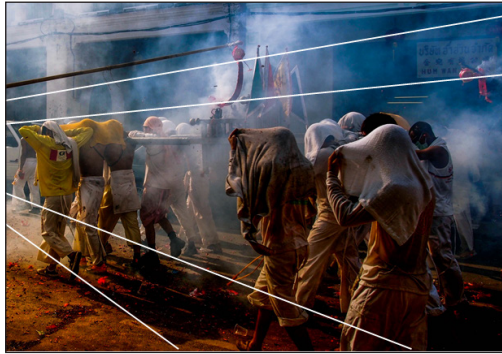
ภาพที่ 2 การจุดปะทัดต้นรับขบวนแห่องค์พระ ปีทมาสน์ พิณนุกูล (2562)