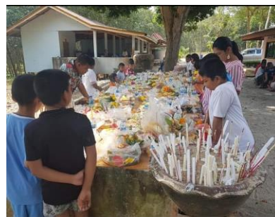
ภาพที่ 6 การตั้งเปรตหลาเปรต