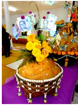
ภาพที่ 2 หมรับ