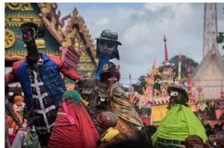
ภาพที่ 4 การแห่จาดและโหงเทง