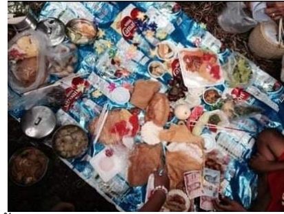
ภาพที่ 5 การตั้งเปรตนอกวัด