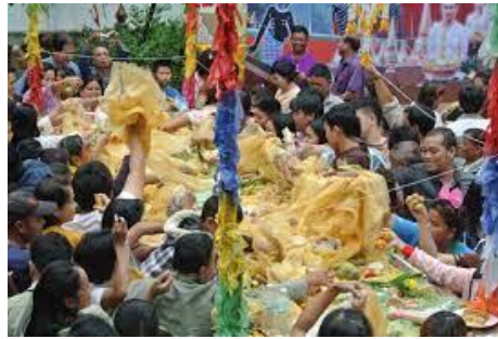
ภาพที่ 7 พิธีกรรมชิงเปรต