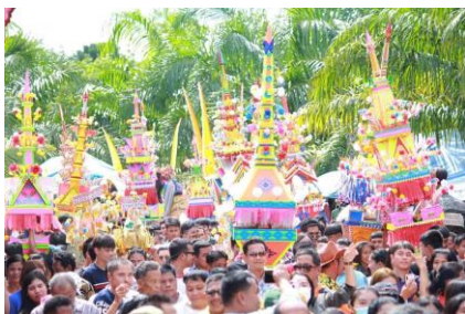
ภาพที่ 3 การแห่จาด