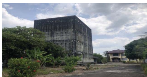
ภาพที่ 8 ตึกรังนกนางแอ่น

6.9 ตึกรังนกนางแอ่น เป็นตึกไม่มีหน้าต่างมีเพียงช่องเล็ก ๆ ไว้สำหรับนกนางแอ่นทำรัง และเก็บเกี่ยวผลผลิตผลจากรังนกนางแอ่นขาย ซึ่งมีราคาสูง