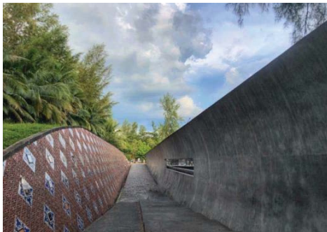
ภาพที่ 1 สวนอนุสรณ์สึนามิบ้านน้ำเค็ม

6.3 ท่าเทียบเรือบ้านน้ำเค็ม เป็นท่าเรือที่ใช้บริการข้ามฟากไปยังเกาะคอเขาทั้งรถยนต์และรถจักรยานยนต์ ค่าบริการรถยนต์ 150 บาท และรถจักรยานยนต์ 20 บาท ใช้เวลาประมาณ 10 นาที