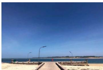
ภาพที่ 2 ท่าเรือบ้านน้ำเค็ม

6.3 ท่าเทียบเรือบ้านน้ำเค็ม เป็นท่าเรือที่ใช้บริการข้ามฟากไปยังเกาะคอเขาทั้งรถยนต์และรถจักรยานยนต์ ค่าบริการรถยนต์ 150 บาท และรถจักรยานยนต์ 20 บาท ใช้เวลาประมาณ 10 นาที