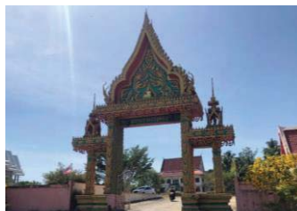
ภาพที่ 7 วัดแหลมป้อม

6.8 วัดแหลมป้อม หรือเรียกว่า วัดน้ำเค็ม ชื่อวัดแหลมป้อมเป็นชื่อที่ใช้จดทะเบียนชื่อของวัด แต่ประชากรในชุมชนจะเรียกว่า วัดน้ำเค็ม สำหรับวัดแหลมป้อมเป็นวัดที่ชาวบ้านน้ำเค็มทั้งชาวไทยและชาวมอญแกนใช้ยึดเหนี่ยวจิตใจ และนิยมมาทำบุญกันโดยเฉพาะในช่วงเทศกาลต่าง ๆ วัดแหลมป้อมยังเป็นที่หลบภัยสึนามิ โดยประชากรจะมาอยู่วัดเป็นจำนวนมากในเวลาคับขัน หรือมีสัญญาณเตือนภัยดัง เนื่องจากทำเลที่ตั้งของวัดอยู่ในพื้นที่สูง