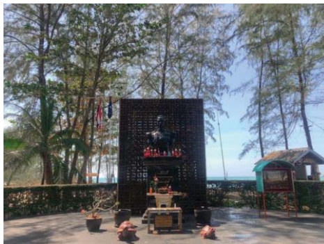
ภาพที่ 5 กรมหลวงชุมพรเขตอุดมศักดิ์ ที่มา : ถ่ายเมื่อ 30 มกราคม 2564

6.6 กรมหลวงชุมพร พระเจ้าบรมวงศ์เธอกรมหลวงชุมพรเขตอุดมศักดิ์ หรือพระเจ้าลูกยาเธอ พระองค์เจ้าอาภากรเกียรติวงศ์ ทรงเป็นต้นราชสกุล “อาภากร” เป็นพระราชโอรสในพระบาทสมเด็จพระจุลจอมเกล้าเจ้าอยู่หัว (ร.5) พระองค์ทรงได้รับสมัญญานามว่า องค์บิดาของทหารเรือไทย พระรูปของกรมหลวงชุมพรเขตอุดมศักดิ์ ตั้งอยู่สวนอนุสรณ์สีนามีบ้านน้ำเค็ม