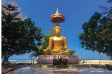
ภาพที่ 6 องค์พระพุทธรูปนั่งปางลอย