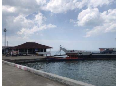
ภาพที่ 4 สะพานทำเทียบเรือบ้านน้ำเค็ม

6.5 สะพานทำเทียบเรือบ้านน้ำเค็ม เป็นสะพานที่ใช้สำหรับตักปลาในตอนเย็น เด็ก ๆ ในชุมชนมักรวมตัวกันเพื่อเล่นน้ำทะเล สะพานทำเทียบเรือบ้านน้ำเค็มเป็นสะพานที่นักท่องเที่ยวนิยมถ่ายรูปในตอนเย็นขณะที่พระอาทิตย์กำลังตก ซึ่งมองไปทางฝั่งตรงข้ามจะเห็นฝั่งเกาะคอเขา