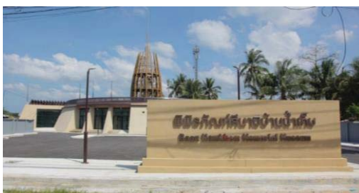
ภาพที่ 3 พิพิธภัณฑ์สึนามิบ้านน้ำเค็ม

6.4 พิพิธภัณฑ์สึนามิบ้านน้ำเค็ม เป็นอนุสรณ์สถานและพิพิธภัณฑ์ เกิดจากผู้ประสบภัยเหตุการณ์ภัยพิบัติคลื่นยักษ์สึนามิร่วมกันคิดบันทึกเรื่องราวชุมชนหลังถูกคลื่นยักษ์สึนามิทำลายหมู่บ้านน้ำเค็ม นำมาสู่การจัดทำเป็นแหล่งเรียนรู้การเกิดปรากฏการณ์เหตุการณ์ภัยพิบัติคลื่นยักษ์สึนามิ เพื่อให้เกิดความเข้าใจเมื่อเกิดสถานการณ์และการหลบหนีคลื่นยักษ์สึนามิ รวมทั้งเป็นแหล่งเก็บรวบรวมข้อมูลสำคัญช่วงที่เกิดเหตุการณ์ภัยพิบัติคลื่นยักษ์สึนามิ ใน พ.ศ.2547