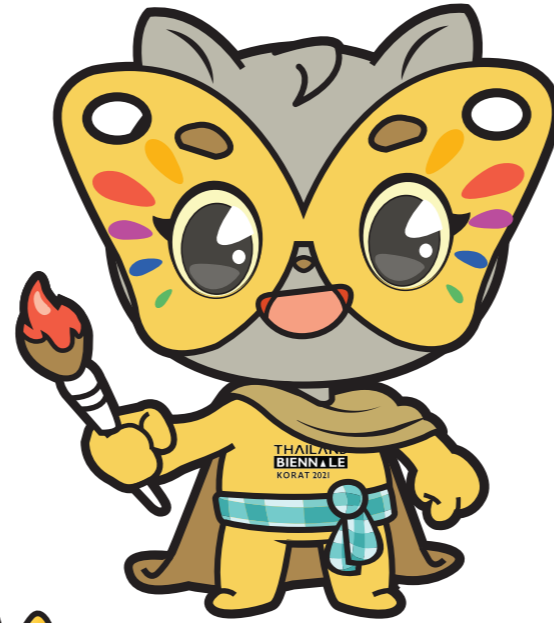
ด้านหน้า