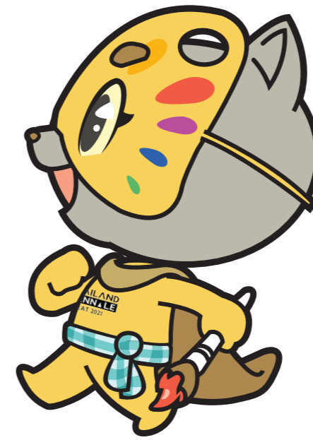
ด้านข้าง