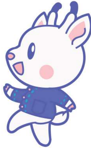
ด้านข้าง