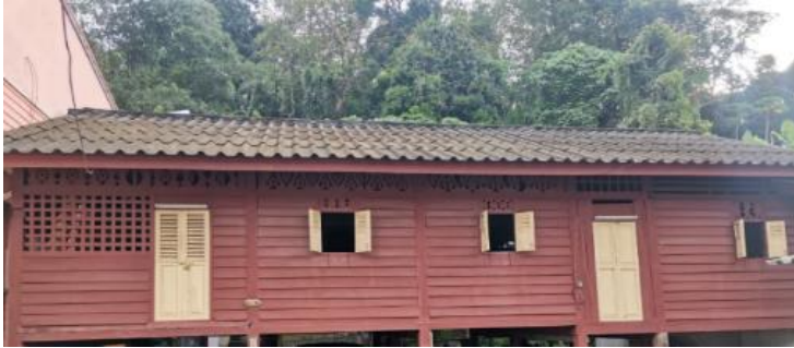
ภาพที่ 1 บ้านร้อยปีของบ้านร้อยปีให้มีเสมอ

การติดตั้งไฟฟ้าเพื่อความสะดวกให้แก่นักท่องเที่ยว การซ่อมแซมและรักษา สภาพความแข็งแรง