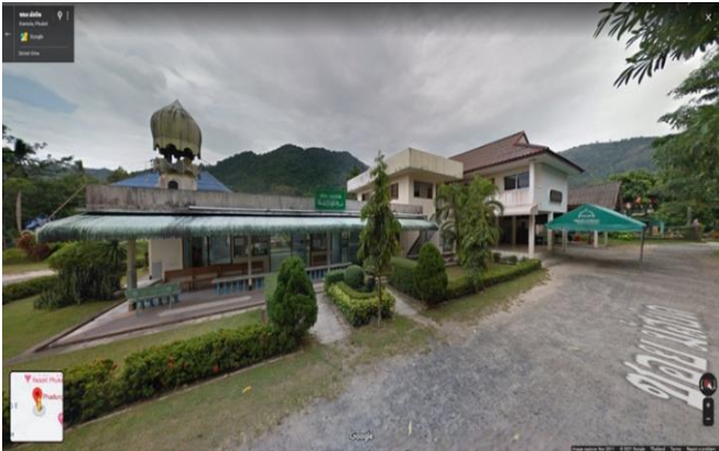
ภาพที่ 4 มัสยิดผดุงศาสตร์

มัสยิดผดุงศาสตร์ เป็นอาคารและศูนย์อบรมจริยธรรมบ้านหัวควน สร้างเมื่อประมาณ พ.ศ.2500 มัสยิดหลังนี้เริ่มต้นจากการเดินทางมาของ อาจารย์ประสาน หมัดอาดัม จากอำเภอหาดใหญ่ จังหวัดสงขลา และเป็น บุคคลแรกที่ผลักดันให้เกิดการขับเคลื่อนและพัฒนาด้านศาสนาอิสลาม โดย เริ่มต้นด้วยการสอนคนในหมู่บ้านหัวควนจำนวนหนึ่ง บริเวณบालายหรือบา แลซึ่งเป็นสถานที่ที่ใช้ประกอบพิธีละหมาดและเรียนหนังสือขนาดเล็ก ทำ จากไม้ไผ่ลงด้วยสังกะสี รองรับจำนวนคนได้ไม่มาก ต่อมาได้มีผู้สนใจและเข้า มาเรียนรู้รวมทั้งทำ