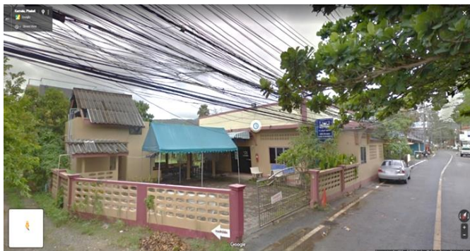
ภาพที่ 5 มัสยิดอัล-บุชรอ

มัสยิดอัล-บุชรอ มุสลิมมีสถานที่เรียนศาสนาของชาวมลายู ตั้งอยู่ในพื้นที่ท่องเที่ยวชายหาดกมลา มัสยิดหลังนี้ใช้สำหรับรองรับการประกอบศาสนกิจ ทั้งของชาวมลายู ผู้มาเยือน และนักท่องเที่ยว ในอดีตชาวไทยมุสลิมบริเวณบ้านกมลาได้พื้นที่ปลูกบ้านเรือนบริเวณบ้านนอก สักกร้า และท้ายกระบ๊าย (บริเวณภูเก็ตแฟนตาซีในปัจจุบัน) เมื่อชาวไทยมุสลิมต้องปฏิบัติศาสนกิจ เช่น การร่วมนมาซ (ละหมาด) ในวันศุกร์ การทำพิธีสำคัญ เช่น เดือนรอมฎอน พิธีเข้าสู่นิตเด็กชาย (ขลิบปลายอวัยวะเพศ) งานบุญ ตลอดจนพิธีศพที่มีการร่วมละหมาดขอพรให้ผู้ตาย (มัยยิต) ชาวไทยมุสลิมจึงจำเป็นต้องเดินทางไปใช้