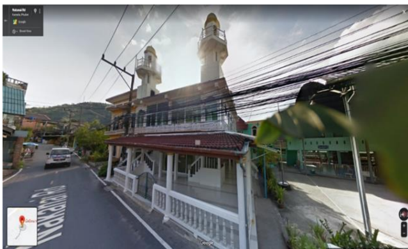
ภาพที่ 3 มัสยิดนูรุลเอียะห์ซาน (นาคา)

มัสยิดนูรุลเอียะห์ซาน (นาคา) เดิมเป็นบาลัย หรือสถานที่ละหมาด ต่อมาได้จัดตั้งเป็นศูนย์อบรมศาสนาอิสลามและจริยธรรม ทั้งสถานที่อบรมจริยธรรมเพื่อปลูกฝังศรัทธา พัฒนาความรู้ คุณคุณธรรมให้แก่เยาวชนและชาวกมลาในหมู่บ้านนาคา ต่อมาใน พ.ศ.2535 บ้านนาคามีผู้อาศัยมากขึ้น ชาวบ้านจึงรวบรวมงบประมาณและก่อสร้างเป็นมัสยิดขึ้น และจดทะเบียนมัสยิดในวันที่ 1 พฤษภาคม พ.ศ.2534