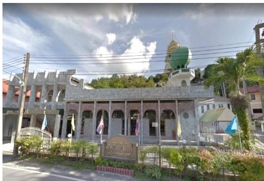
ภาพที่ 2 บ้านกมลา

มัสยิดบ้านกมลา หรือมัสยิดกำมะรา เป็นมัสยิดแห่งแรกของตำบล กมลา ตั้งอยู่บ้านเหนือ หมู่ 2 เป็นพื้นที่ที่มีประชากรอาศัยอยู่จำนวนมาก มัสยิดหลังนี้สร้างขึ้นเมื่อวันที่ 2 ธันวาคม พ.ศ.2519 มีอายุประมาณ 35 ปี เป็นมัสยิดที่ชาวกมลาทั้ง 6 หมู่บ้านใช้เป็นสถานที่ในการประกอบพิธีกรรม ทางศาสนาอิสลาม มัสยิด