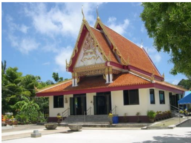
ภาพที่ 7 สำนักสงฆ์เจริญธรรมกมลา

อดีตพุทธศาสนิกชนต้องเดินทางไปประกอบพิธีที่วัดบางเทา หรือวัดป่าตอง ใน พ.ศ.2503 พี่น้องชาวไทยพุทธได้ร่วมใจกันปรับปรุงพื้นที่ว่างบริเวณด้านหน้าติดคลองปากบาง ด้านหน้าติดชายหาดกมลา ด้านข้างติดโรงเรียนบ้านกมลา และพื้นที่ว่างติดสะพานข้ามคลองปากบางไปสู่หาดหอยขี้ และหาดสาย บริเวณดังกล่าวเป็นอาคารที่พัก พักสงฆ์ เมื่อมีภิกษุสงฆ์มาจำพรรษาได้มีการพัฒนาก่อสร้างอาคาร โบสถ์ พระประธาน เพื่อความสะดวกต่อชาวไทยพุทธและนักท่องเที่ยวที่มายังชุมชนกมลา ภายหลังสถานที่ดังกล่าวได้ยกฐานะเป็นสำนักสงฆ์เจริญธรรมกมลา ใน พ.ศ.2547 ได้เกิดเหตุการณ์สึนามิบริเวณหาดกมลา ปากคลอง ปากบาง สำนักสงฆ์ โรงเรียนบ้านกมลาได้รับความเสียหาย แต่ที่น่าประหลาดใจ คือ อาคารโบสถ์มีระดับน้ำท่วมเกือบถึงปลายยอด แต่ไม่ได้รับความเสียหาย เมื่อเหตุการณ์สึนามิสิ้นสุดลงชาวไทยพุทธชุมชนกมลาและผู้มีจิตศรัทธาได้ระดมทุนก่อสร้างโบสถ์หลังใหม่ ปรับปรุงพื้นที่โดยรอบให้มี ความสะดวกและสะอาด พร้อมรองรับการปฏิบัติศาสนกิจมาก