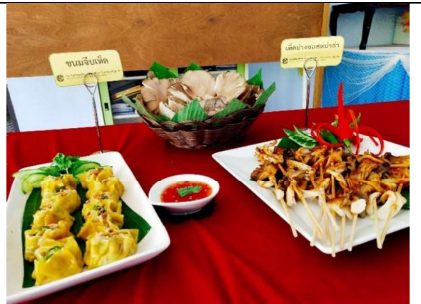
ภาพที่ 4 การแปรรูปเห็ด