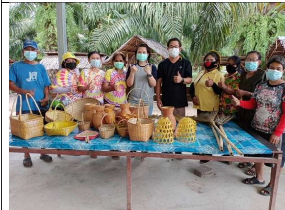
ภาพที่ 11 การพัฒนาต่อยอดอาชีพการเพาะเห็ด สู่อาชีพเครื่องจักสานจากทางปาล์ม