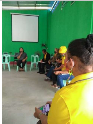
ภาพที่ 8 การแลกเปลี่ยนเรียนรู้