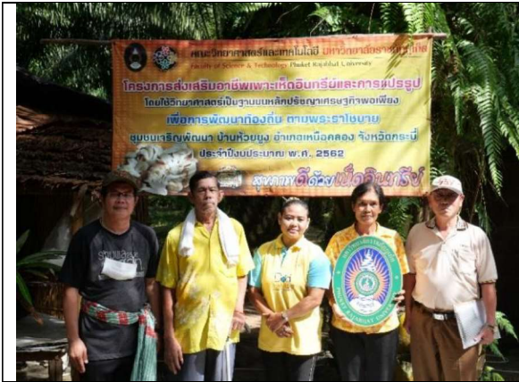
ภาพที่ 1 โรงเรือนเพาะและเปิดดอกเห็ด