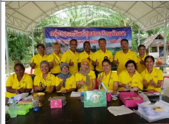
ภาพที่ 9 กลุ่มออมทรัพย์ชุมชนเจริญพัฒนา