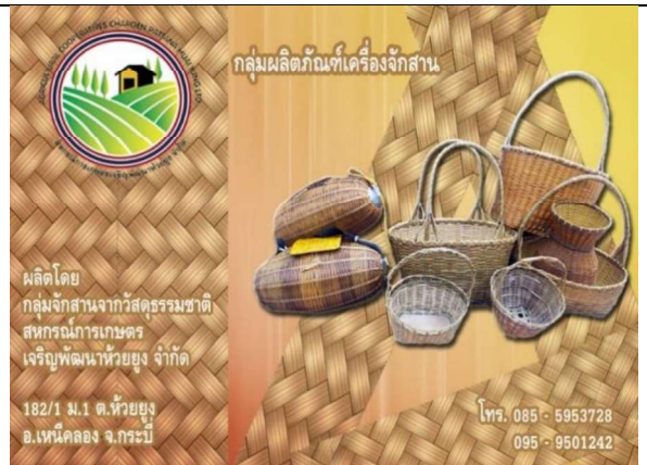
ภาพที่ 12 กลุ่มผลิตภัณฑ์เครื่องจักสาน สหกรณ์การเกษตร เจริญพัฒนาห้วยยูง จำกัด