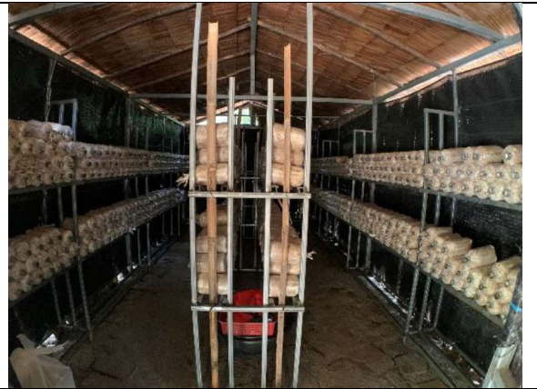
ภาพที่ 2 โรงเรือนเพาะและเปิดดอกเห็ด