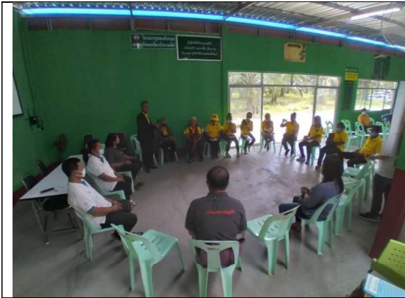
ภาพที่ 7 การแลกเปลี่ยนเรียนรู้