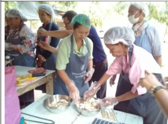
ภาพที่ 3 การแปรรูปเห็ด