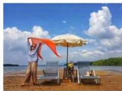
คืนแควมังกร