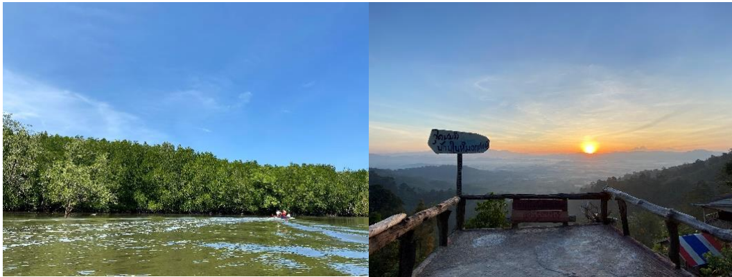
ภาพที่ 1 ป่าชายเลยในพื้นที่ทุ่งมะพร้าว (ภาพซ้าย) และจุดชมวิวทะเลหมอก (ภาพขวา)

การลงพื้นที่เพื่อสำรวจเส้นทางท่องเที่ยวของชุมชนทุ่งมะพร้าวของการศึกษาคั้งนี้จึงนำนักท่องเที่ยวเดินทางประเมินกิจกรรมชมวิวทะเลหมอกเขาไฉ่น้อย ในลักษณะ 2 วัน 1 คืน โดยมีสถานที่พักแรมตั้งอยู่บนเนินเขา ณ จุดชมวิว ซึ่งผลการศึกษาแสดงดังตารางที่ 1 โดยผลการประเมินความพึงพอใจนักท่องเที่ยวทั้ง 5 ด้าน พบว่านักท่องเที่ยวมีความพึงพอใจมากที่สุดจำนวน 2 ด้าน และมีความพึงพอใจระดับมาก จำนวน 3 ด้าน แสดงรายละเอียดดังตารางที่ 2 นอกจากนั้นผลการประเมินความพึงพอใจในแต่ละด้านเรียงลำดับจากมากไปน้อยได้ดังนี้ ด้านพื้นที่ ด้านสภาพแวดล้อม ด้านกระบวนการ ด้านกิจกรรม และด้านบริหารจัดการ