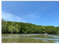
ป่าชายเลน