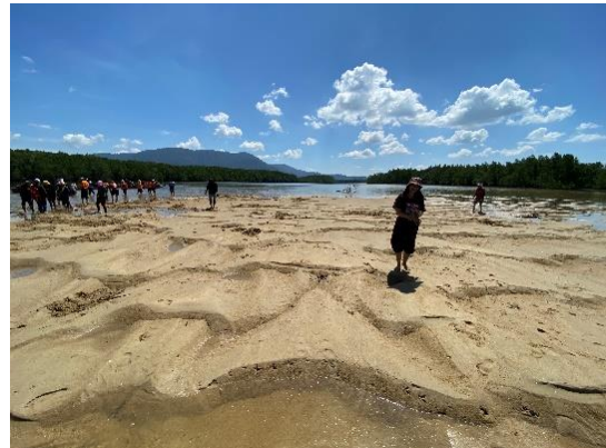
ภาพที่ 3 ล่องแพไม้ไผ่ตามแนวป่าโกงกาง (ภาพซ้าย) และสันหลังมังกรและกิจกรรมหาหอยตลับ (ภาพขวา)