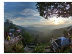
ทะเลหมอก