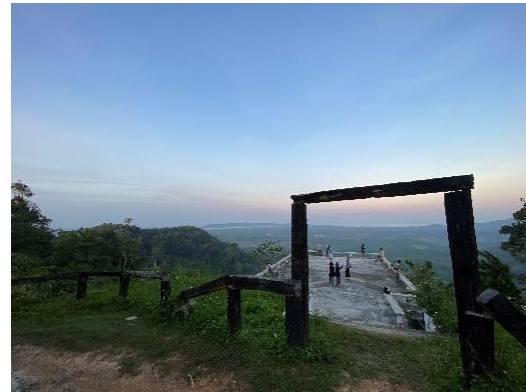
ภาพที่ 2 จุดชมวิพระอาทิตย์ขึ้นและทะเลหมอก (ภาพซ้าย) และจุดชมวิพระอาทิตย์ตกและทะเล อันดามัน (ภาพขวา)