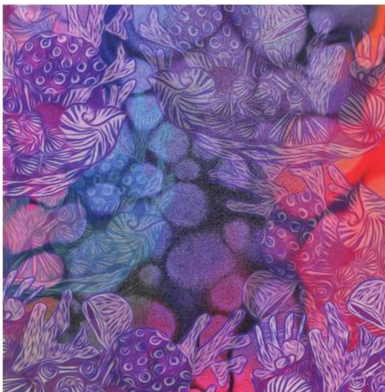
ผศ.ดร.สรวิชัย คุมทอง "Undersea Rhythm" เทคนิคผสม 50 x 50 ซม.