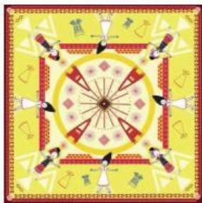
ชื่อผลงาน หัวใจดวงอาทิตย์ ๖ ขนาด 45x45 เซนติเมตร เทคนิค คอมนิวตอรัลราดิคัล ปีศิลปะ -