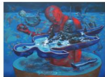
ชื่อผลงาน Inside and Outside ขนาด 80x60 เซนติเมตร เทคนิค สีอะครีลิคบนผ้าใบ ปีศิลปะ 2564