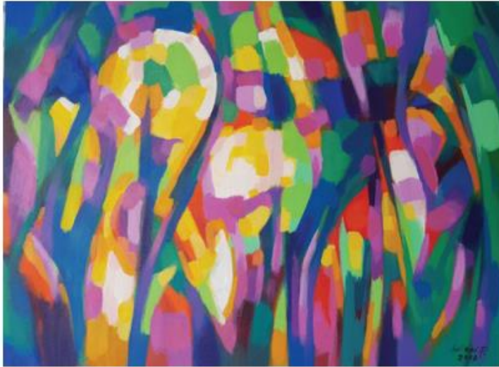
ชื่อผลงาน คำถามและคำตอบ ขนาด 80 X 100 เซนติเมตร เทคนิค สีอะครีลิค ปี 2561