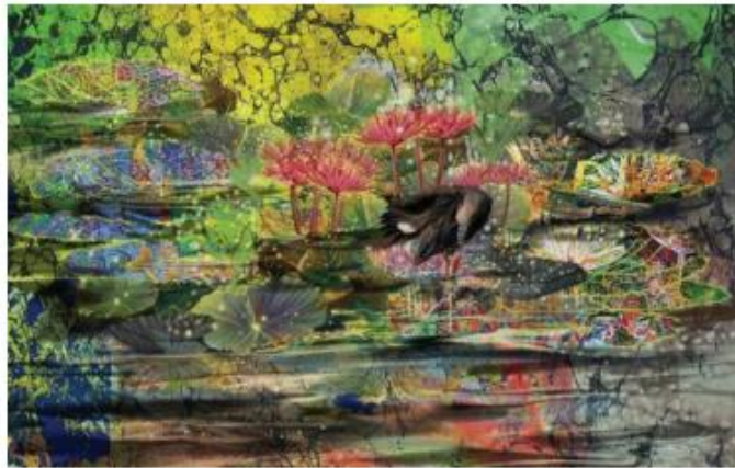
ชื่อผลงาน พลาญภาพแห่งสายธาร ขนาด 49x29 เซนติเมตร เทคนิค Silkscreen and Digital Painting ปีที่สร้าง 2564