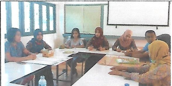
บรรยากาศการสะท้อนผลหลังการสอนครูผู้สอน ชั้นประถมศึกษาปีที่ 2