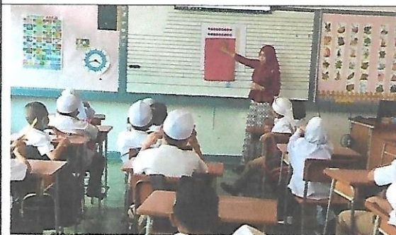
บรรยากาศการจัดการเรียนการสอน ชั้นประถมศึกษาปีที่ 1