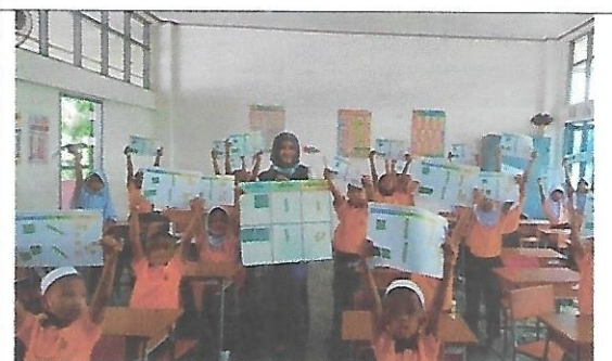
บรรยากาศการจัดการเรียนการสอน ชั้นประถมศึกษาปีที่ 2