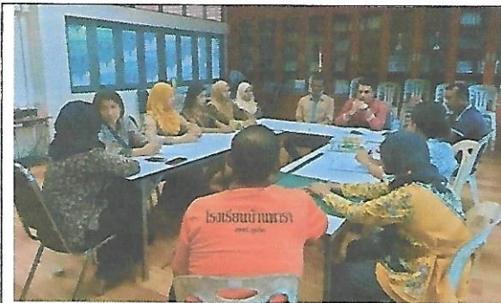
บรรยากาศการประชุมวางแผนการนำผลการวิจัยไปใช้ในการจัดการเรียนการสอนวิชาคณิตศาสตร์

ภาพประกอบการนำผลงานวิจัยไปใช้ประโยชน์ (3-5 รูป) หรือหลักฐานในการนำผลงานวิจัยไปใช้ในการอ้างอิง