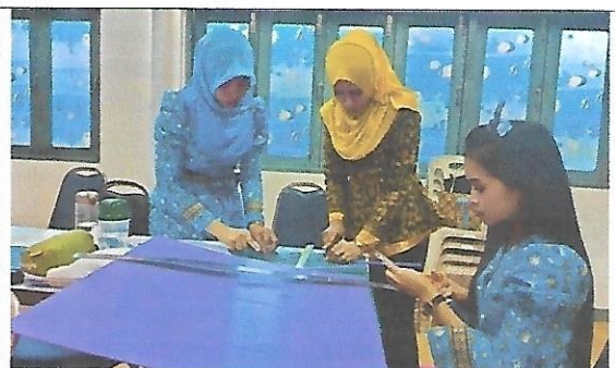
ครูผู้สอนและครูผู้สังเกตที่เป็นทีมการศึกษาชั้นเรียนร่วมกันวางแผนการสอนและจัดทำสื่อการสอนร่วมกัน