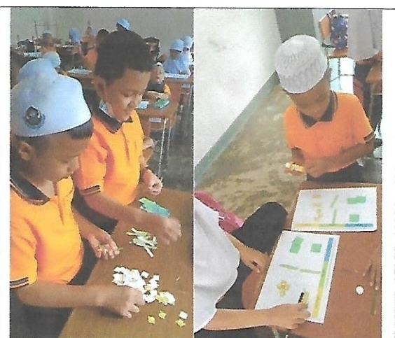
บรรยากาศการทำกิจกรรมของนักเรียน ชั้นประถมศึกษาปีที่ 2