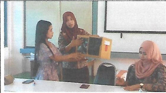
บรรยากาศการสะท้อนผลหลังการสอนของ ครูผู้สังเกตชั้นประถมศึกษาปีที่ 1