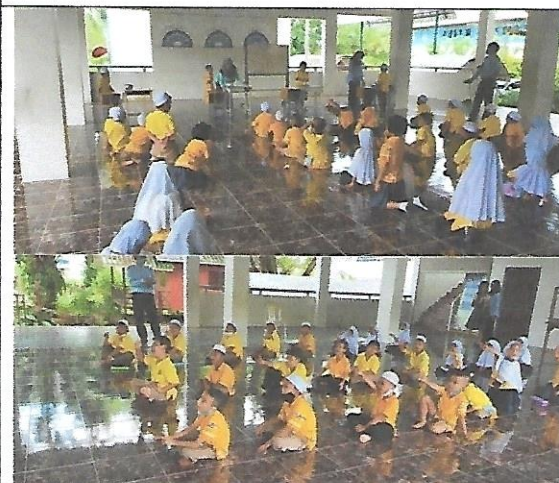
บรรยากาศการสอนและการสังเกตชั้นเรียนร่วมกันของ ครูผู้สังเกตและผู้บริหารโรงเรียน ในชั้นประถมศึกษาปีที่ 1