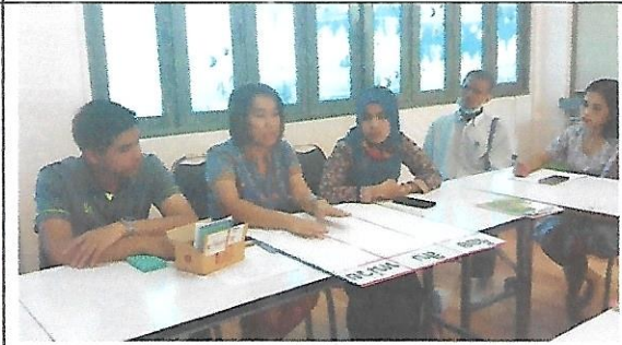
บรรยากาศการสะท้อนผลหลังการสอนของ ครูผู้สังเกตชั้นประถมศึกษาปีที่ 2