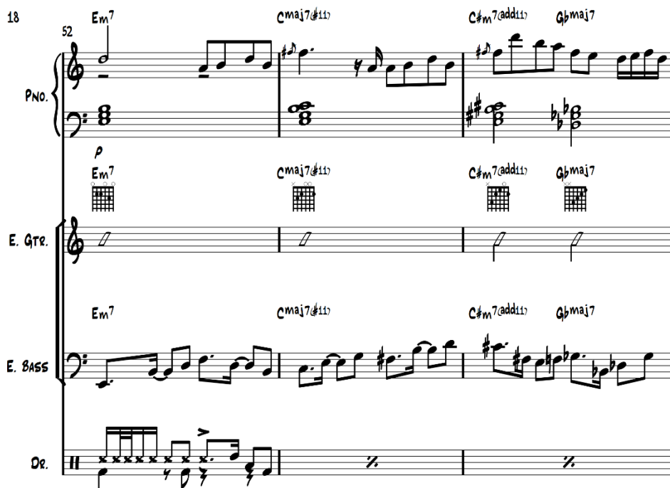
รูปที่ 10 แสดงการดำเนินทำนองในท่อน D โดยใช้จังหวะกลองแบบ Half time

เป็นท่อนที่นำเสนอลีลาของดนตรีที่ให้ความรู้สึก ผ่อนคลาย เขือกเย็น โดยผู้ประพันธ์กำหนดเพลงให้ช้าลง โดยการผ่อนจังหวะ (Ritenuato) โดยการปรับรูปแบบจังหวะกลองชุดในตำแหน่งของกลองสแนร์ ให้เน้นที่จังหวะที่ 3 เพื่อประกอบจังหวะของท่อนนี้ นอกจากนี้ผู้ประพันธ์ยังได้ประพันธ์ทำนองที่อ้างอิงมาจากทำนองออกทงายี่ของดนตรีหนังตะลุง ที่ให้ความรู้สึกสงบ เข้ามาสนับสนุนอีกด้วย ดังรูปที่ 10