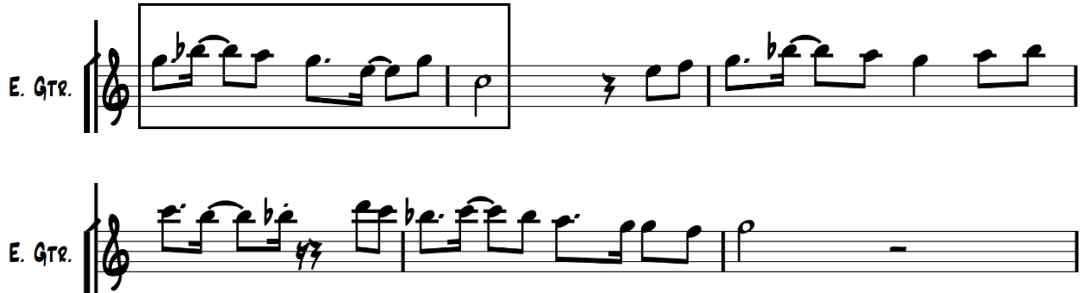
รูปที่ 9 แสดงการเริ่มต้นประโยคเพลงที่ 2 ด้วยเทคนิคการพัฒนาทำนองแบบเดียวประโยคเพลงที่ 1