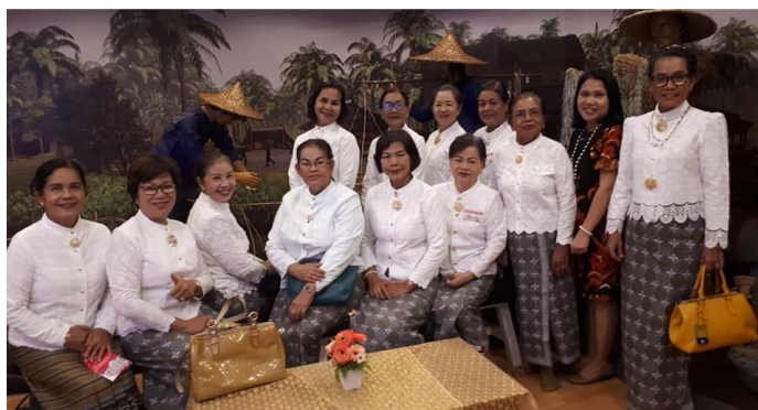
ภาพที่ 8 การศึกษาดูงานพิพิธภัณฑ์ชุมชนบางเหนียว

กิจกรรมที่ 4 เรียนรู้แหล่งสารสนเทศคว้าด้วยอาหารภูเก็ตในชุมชน ประกอบด้วยกิจกรรม การศึกษาดูงานแหล่งสารสนเทศที่สำคัญ ได้แก่ พิพิธภัณฑ์ชุมชนบ้านบางเหนียว ศาลเจ้าพ่อต๋อแก้ว