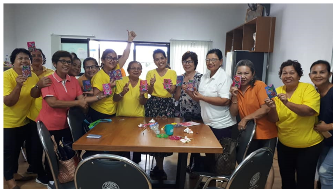
ภาพที่ 14 ผู้สูงอายุกับการทำของที่ระลึกเพื่อการท่องเที่ยว

กิจกรรมที่ 7 เรียนรู้การใช้สมาร์ทโฟนที่เหมาะสมสำหรับผู้สูงอายุ ประกอบด้วยกิจกรรมการเรียนรู้การใช้ Line บนสมาร์ทโฟน การถ่ายภาพด้วยสมาร์ทโฟน และการตกแต่งภาพการ์ตูนบนสมาร์ทโฟน