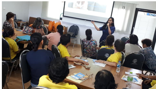
ภาพที่ 13 การให้ความรู้เกี่ยวกับการใช้แอปพลิเคชันในการจองตั๋วเครื่องบินและที่พัก