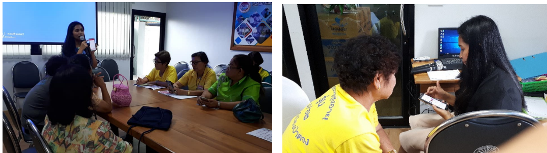
ภาพที่ 4-5 การให้ความรู้เกี่ยวกับการใช้แอปพลิเคชันสั่งอาหาร

กิจกรรมที่ 3 เรียนรู้สารสนเทศอาหารภูเก็ตและความเป็นเมืองเครือข่ายสร้างสรรค์ด้านวิทยาการอาหารของยูเนสโก (Phuket city of gastronomy) ประกอบด้วยกิจกรรมการให้ความรู้เกี่ยวกับอาหารพื้นเมืองภูเก็ต ภูเก็ต : เมืองเครือข่ายสร้างสรรค์ด้านวิทยาการอาหารของยูเนสโก พร้อมของตัวอย่างและสื่อประกอบ ได้แก่ เพลงของกินภูเก็ตหรรษา ตัวอย่างขนมพื้นเมืองภูเก็ต เว็บไซต์ว่าด้วยภูเก็ต : เมืองเครือข่ายสร้างสรรค์ด้านวิทยาการอาหารของยูเนสโก และการสาธิตและทำขนมอังกุ