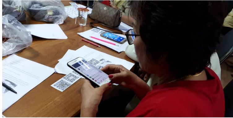
ภาพที่ 3 การเรียนรู้แหล่งสารสนเทศอาหารผ่านคิวอาร์โค้ด

กิจกรรมที่ 2 เรียนรู้สารสนเทศและเทคโนโลยีสารสนเทศว่าด้วยอาหาร ประกอบด้วยกิจกรรมการให้ความรู้เกี่ยวกับสารสนเทศ แหล่งสารสนเทศ และเทคโนโลยีสารสนเทศที่เกี่ยวข้องกับอาหาร พร้อมตัวอย่างและสื่อประกอบ ได้แก่ แอปพลิเคชัน food panda delivery เว็บไซต์เกี่ยวกับอาหาร