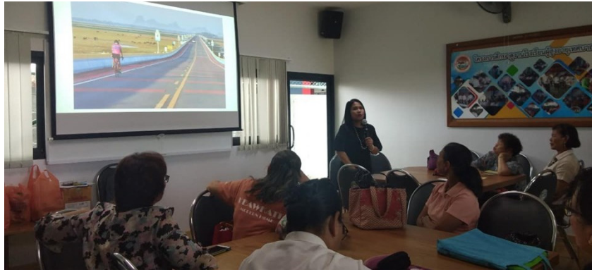
ภาพที่ 12 การให้ความรู้เกี่ยวกับแหล่งท่องเที่ยวและแนะนำแหล่งท่องเที่ยวที่เหมาะสมสำหรับผู้สูงอายุ