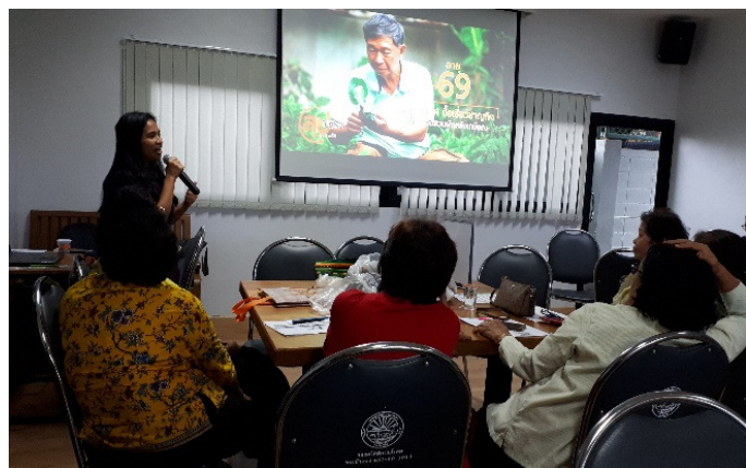
ภาพที่ 1- 2 การให้ความรู้เรื่องความรู้และองค์ความรู้ในตัวผู้สูงอายุ