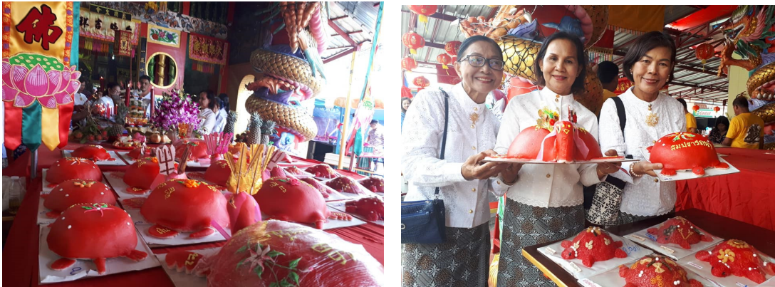
ภาพที่ 9-10 การศึกษาดูงานพิธีกรรมในประเพณีพ้อต่อภูเก็ต ณ ศาลเจ้าพ้อต่อกง

กิจกรรมที่ 5 เรียนรู้สารสนเทศอาหารสำหรับผู้สูงอายุ ประกอบด้วยกิจกรรมการเรียนรู้เกี่ยวกับสารสนเทศอาหารที่เหมาะสมสำหรับผู้สูงอายุ พร้อมตัวอย่างสื่อ ได้แก่ เว็บไซต์เกี่ยวกับอาหารผู้สูงอายุ คลิปวีดิทัศน์เกี่ยวกับการรับประทานอาหาร 5 หมู่ที่เหมาะสมสำหรับผู้สูงอายุ