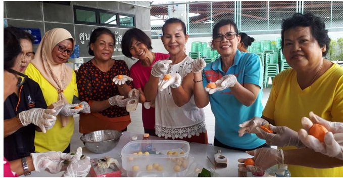
ภาพที่ 6 การเรียนรู้เรื่องการทำขนมอังกู๋ ขนมมงคลภูเก็ต