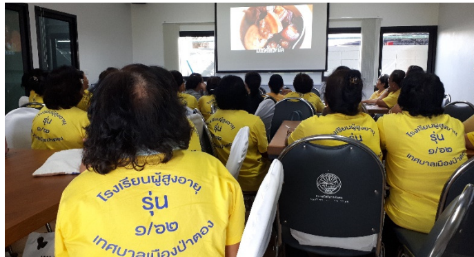
ภาพที่ 7 เรียนรู้อาหารภูเก็ตจากเพลง

กิจกรรมที่ 4 เรียนรู้แหล่งสารสนเทศคว้าด้วยอาหารภูเก็ตในชุมชน ประกอบด้วยกิจกรรม การศึกษาดูงานแหล่งสารสนเทศที่สำคัญ ได้แก่ พิพิธภัณฑ์ชุมชนบ้านบางเหนียว ศาลเจ้าพ่อต๋อแก้ว