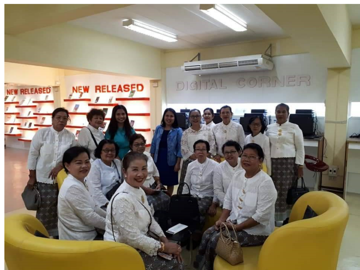
ภาพที่ 17 การศึกษาดูงานหอสมุดมหาวิทยาลัยราชภัฏภูเก็ต

กิจกรรมที่ 8 เรียนรู้แหล่งสารสนเทศที่ใหญ่ที่สุดในจังหวัดภูเก็ต ประกอบด้วยกิจกรรม การศึกษาดูงานหอสมุดมหาวิทยาลัยราชภัฏภูเก็ต ได้แก่ การศึกษาดูงานบริการของหอสมุด การฝึกปฏิบัติการใช้ คอมพิวเตอร์และสืบค้นข้อมูลบนอินเทอร์เน็ต