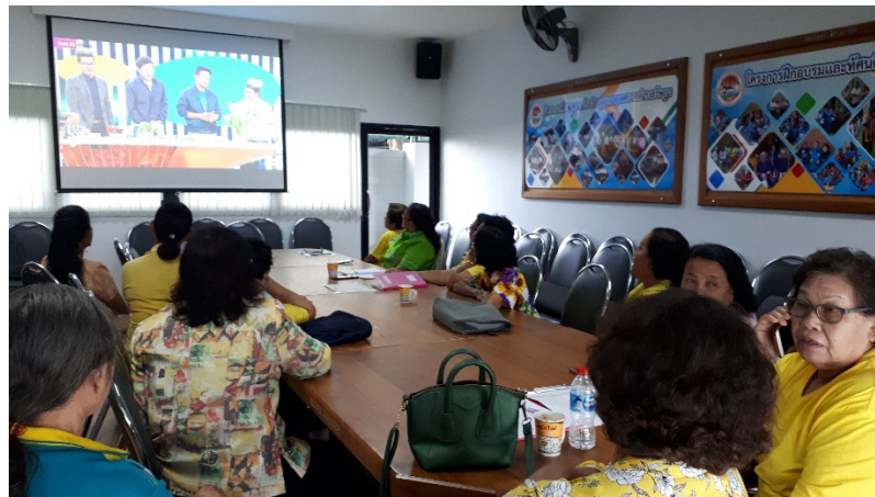
ภาพที่ 11 การเรียนรู้เกี่ยวกับอาหารสำหรับผู้สูงอายุจากสื่อ

กิจกรรมที่ 5 เรียนรู้สารสนเทศอาหารสำหรับผู้สูงอายุ ประกอบด้วยกิจกรรมการเรียนรู้เกี่ยวกับสารสนเทศอาหารที่เหมาะสมสำหรับผู้สูงอายุ พร้อมตัวอย่างสื่อ ได้แก่ เว็บไซต์เกี่ยวกับอาหารผู้สูงอายุ คลิปวีดิทัศน์เกี่ยวกับการรับประทานอาหาร 5 หมู่ที่เหมาะสมสำหรับผู้สูงอายุ