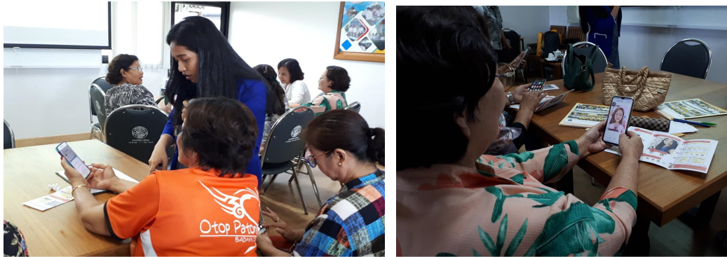
ภาพที่ 15-16 การเรียนรู้เกี่ยวกับการใช้สมาร์ทโฟนเพื่องานต่าง ๆ

กิจกรรมที่ 8 เรียนรู้แหล่งสารสนเทศที่ใหญ่ที่สุดในจังหวัดภูเก็ต ประกอบด้วยกิจกรรม การศึกษาดูงานหอสมุดมหาวิทยาลัยราชภัฏภูเก็ต ได้แก่ การศึกษาดูงานบริการของหอสมุด การฝึกปฏิบัติการใช้ คอมพิวเตอร์และสืบค้นข้อมูลบนอินเทอร์เน็ต