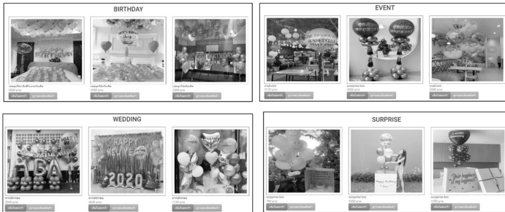
รูปที่ 4 หน้าแสดงสินค้าที่แยกตามหมวดหมู่