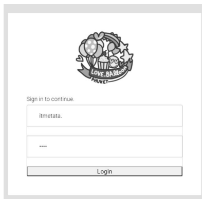
รูปที่ 6 แสดงหน้าเข้าสู่ระบบหลังร้านในส่วนของผู้ใช้งาน

2. วิเคราะห์และประเมินประสิทธิภาพของระบบผู้วิจัยได้ทำการเก็บข้อมูลและวิเคราะห์เพื่อประเมินประสิทธิภาพการใช้งานระบบ โดย ลูกค้าและเจ้าของกิจการจำนวน 22 คน ใช้วิธีการสุ่มแบบบังเอิญผลที่ได้สามารถสรุปเป็นตารางได้ดังนี้