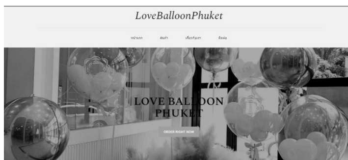
รูปที่ 2 แสดงหน้าหลักของผู้ใช้งานระดับลูกค้า

1. ผลการพัฒนาระบบ ผู้วิจัยได้ทำการพัฒนาระบบตามหลักการของการพัฒนาระบบ (System Development Life Cycle : SDLC) ในการพัฒนาเว็บแอปพลิเคชันสำหรับร้านเลิฟบอลลูนภูเก็ต โดยมีขั้นตอนทั้งหมด 6 ขั้นตอน คือกำหนดปัญหา การวิเคราะห์และออกแบบระบบ พัฒนาโปรแกรม ทดสอบโปรแกรมที่ถูกพัฒนาขึ้นเพื่อตรวจสอบหาข้อผิดพลาด นำโปรแกรมไปทดลองกับผู้ใช้จริง ผลการพัฒนาระบบเป็นดังรูปต่อไปนี้