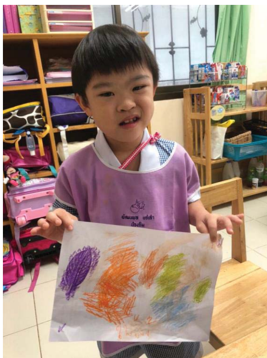
ภาพ 10 ผลงานศิลปะภาพพิมพ์จากใบไม้