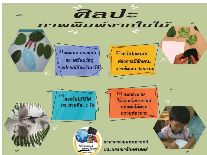
ภาพ 2 ขั้นตอนการทำภาพพิมพ์จากสีเทียนใน

โดยมีขั้นตอนการทำภาพพิมพ์จากสีเทียน คือ 1. คิด ออกแบบและเตรียมวัสดุ อุปกรณ์ที่จะนำมาใช้ 2. หาใบไม้ตามที่ต้องการ มีลักษณะลายชัดเจน สวยงาม 3. สอดใบไม้ไว้ที่กระดาษที่ละ 1 ใบ และ 4. กดกระดาษไว้แล้วเริ่มระบายสีตกแต่งได้ตามความต้องการ