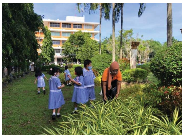
ภาพ 5 ขั้นตอนการทำใบไม้