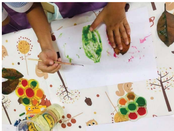
ภาพ 7 ศิลปะภาพพิมพ์จากใบไม้ด้วยสีน้ำ