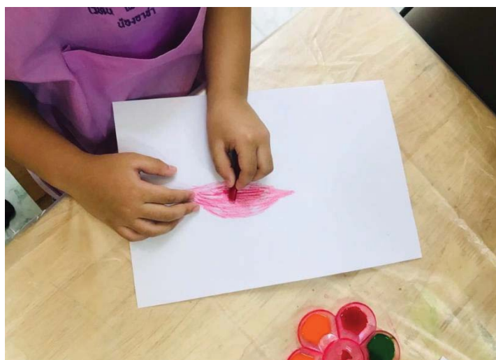
ภาพ 8 ศิลปะภาพพิมพ์จากใบไม้ด้วยสีเทียน