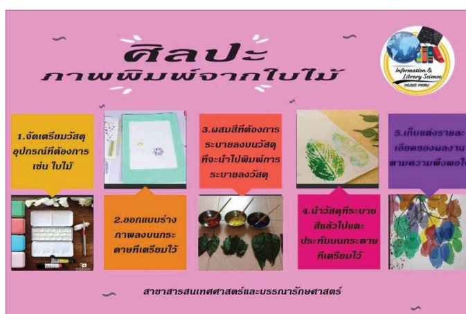
ภาพ 3 ขั้นตอนการทำภาพพิมพ์จากสีน้ำ

ขั้นตอนการทำภาพพิมพ์จากสีน้ำ คือ 1. จัดเตรียมวัสดุ อุปกรณ์ที่ต้องการ 2. ออกแบบร่างภาพลงบนกระดาษที่เตรียมไว้ 3. ผสมสีที่ต้องการระบายลงบนวัสดุที่จะนำไปพิมพ์ และระบายลงบนวัสดุ 4. นำวัสดุที่ระบายสีแล้วไปแตะประทับบนกระดาษที่เตรียม และ 5. เก็บแต่งรายละเอียดของผลงานตามความพึงพอใจ