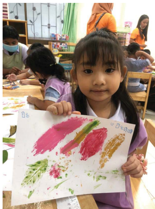
ภาพ 13 ผลงานศิลปะภาพพิมพ์จากใบไม้