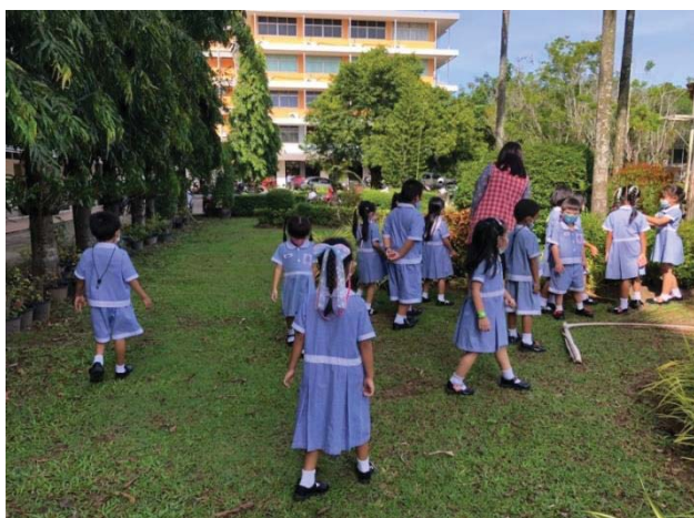
ภาพ 4 ขั้นตอนการทำใบไม้