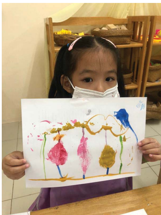
ภาพ 12 ผลงานศิลปะภาพพิมพ์จากใบไม้