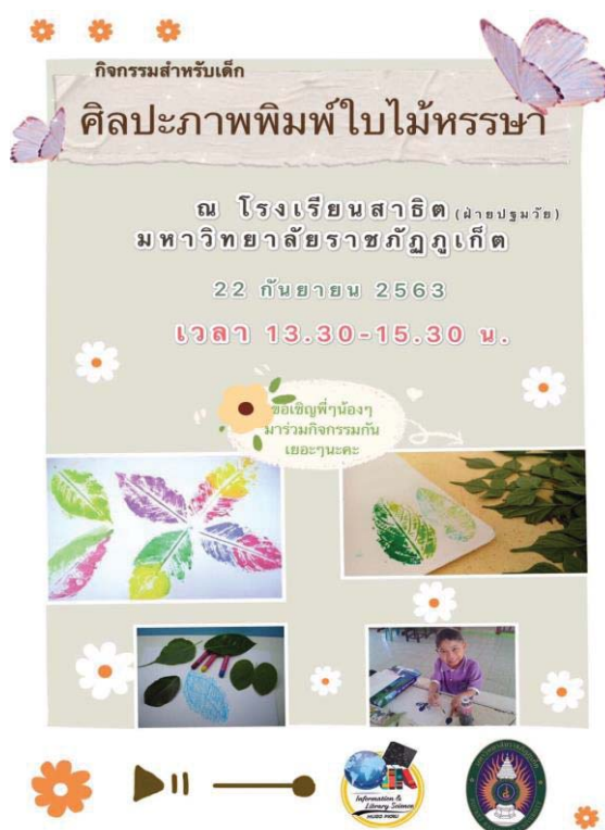
ภาพ 1 โปสเตอร์ประชาสัมพันธ์การจัดกิจกรรมบริการศิลปะภาพพิมพ์จากใบไม้

การจัดกิจกรรมเริ่มจากการทำบันทึกข้อความไปยังโรงเรียนสาธิต เพื่อที่จะจัดกิจกรรม จากนั้นออกแบบโปสเตอร์ประชาสัมพันธ์กิจกรรม จัดทำ Infographic เพื่ออธิบายขั้นตอนการทำศิลปะ ภาพพิมพ์ จัดทำ QR code หนังสืออิเล็กทรอนิกส์ที่เกี่ยวข้อง และจัดหาหนังสือที่เกี่ยวกับการระบายสี ทั้งแบบสีเทียนและสีน้ำ เพื่อจัดมุมสื่อทรัพยากรที่เกี่ยวข้อง