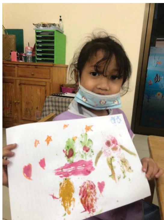
ภาพ 11 ผลงานศิลปะภาพพิมพ์จากใบไม้