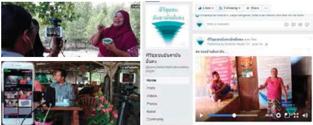
ภาพที่ 1 ซ้าย - การใช้สมาร์ตโฟนผลิตรายการทีวีชุมชน ขวา- เพจเฟซบุ๊กทีวีชุมชนอันดามันมั่นคง

สำหรับเครื่องมือที่ใช้ในการผลิตรายการ [3] แบ่งออกเป็น 2 ส่วนคือ (1) ชุดเครื่องมือที่ประชาชนในแต่ละพื้นที่ใช้ผลิตวีดิทัศน์เพื่อส่งให้สถานีออกอากาศ ได้แก่ สมาร์ทโฟนใช้สำหรับถ่ายวีดิทัศน์และตัดต่อ โดยใช้แอปพลิเคชัน Kinemaster หรือ Imovie ขาดังกล้องหรือไมโครโฟน และหูฟังหรือสมอลทอล์กซึ่งสามารถใช้เป็นไมโครโฟนบันทึกเสียงให้มีความชัดเจน (2) ชุดเครื่องมือที่ใช้ผลิตรายการโทรทัศน์และออกอากาศของศูนย์การผลิต ประกอบด้วย สมาร์ทโฟน 2-3 เครื่อง เพื่อให้มีมุมมองที่หลากหลาย ขาดังกล้อง ตัวยึดสมาร์ทโฟนสำหรับถ่ายวีดิทัศน์ ไมโครโฟนไร้สายและแบบมีสาย เลือกใช้ในสถานการณ์ที่แตกต่างกัน ไอแพดและแอปพลิเคชัน Switcher Studio ใช้เพื่อควบคุมเสียง ตัดสลับภาพจากมุมมองต่างๆ ใส่ตัวอักษร และส่งสัญญาณเพื่อออกอากาศผ่านเพจเฟซบุ๊กที่ทีวีชุมชนอันดามันมั่นคง หูฟังหรือสมอลทอล์กต่อเชื่อมกับไอแพด เพื่อตรวจสอบคุณภาพเสียงระหว่างการออกอากาศ นอกจากนี้หากแสงไม่เพียงพอก็จะใช้ชุดไฟแอลอีดี พร้อมขาดังไฟ ทั้งนี้ชุดเครื่องมือดังกล่าวสามารถใช้ผลิตรายการโทรทัศน์ได้ทั้งในสถานที่และนอกสถานที่