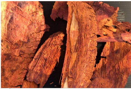
ภาพที่ 10 แสมตากแห้ง

(4) สีส้มได้จากแสม โดยการปอกเอาเปลือกไม้แสม นำเปลือกไม้แสมมาตากให้แห้ง แล้วนำมาเปลือกต้มกับน้ำ แล้วกรองเอาเปลือกไม้ ออก