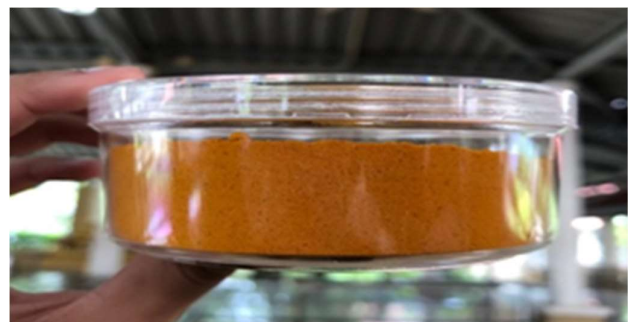
ภาพที่ 9 ผงขมิ้น