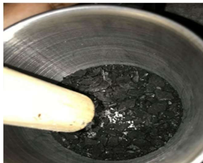
ภาพที่ 6 นำกะลาที่เผาแล้วมาตำให้เป็นผง

(2) สีดำได้จากกะลามะพร้าว โดยทำให้เป็นผงก่อนนำไปใช้ วิธีทำคือ นำกะลามะพร้าวมาเผาให้เป็นถ่าน และมาตำให้เป็นผง นำกระซอนมากรองให้เป็นผงละเอียด