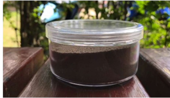
ภาพที่ 5 โคลนแห้งและบดละเอียดแล้ว

(2) สีดำได้จากกะลามะพร้าว โดยทำให้เป็นผงก่อนนำไปใช้ วิธีทำคือ นำกะลามะพร้าวมาเผาให้เป็นถ่าน และมาตำให้เป็นผง นำกระซอนมากรองให้เป็นผงละเอียด