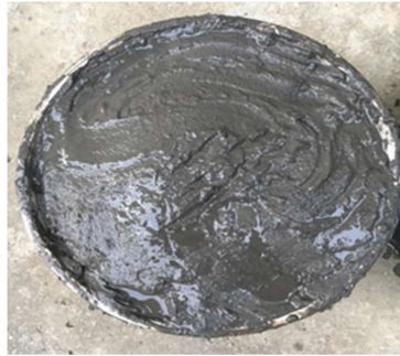
ภาพที่ 4 โคลนทะเลธรรมชาติ

(1) สีเทาได้จากโคลน โดยทำให้เป็นผงก่อนนำไปใช้ วิธีทำคือ ตั้งไฟประมาณ 100 องศาเซลเซียส นำซีโคลนสะอาดใส่ถึงปี๊บ ใส่ น้ำทะเลให้โคลนจมประมาณ 1 นิ้ว ต้มให้เดือดเพื่อฆ่าเชื้อ หลังจากนั้นเอามาตากแดด 3-4 แดด แล้วนำโคลนที่ตากแดดมาตำให้เป็นผง