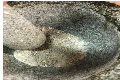
ภาพที่ 3 ตำเปลือกหอยทะเลที่เผาแล้วให้เป็นผงละเอียด

2. น้ำสารส้ม ได้จากการนำสารส้มที่เป็นก้อนมาแกว่งให้ละลายกับน้ำ แล้วกรองหรือตักเอาน้ำใช้เลยก็ได้ น้ำสารส้มจะใส และไม่มีกลิ่น