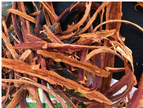
ภาพที่ 12 เปลือกโกก่างตากแห้ง

(5) สีนํ้าตาลออกส้มได้จากโกก่าง โดยการปอกเอาเปลือกไม้โกก่าง นำเปลือกไม้มาตากให้แห้ง และนำมาแช่ในน้ำ 3 วัน หลังจากนั้นนำน้ำที่ได้มาต้มให้เดือด