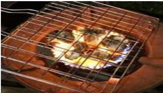
ภาพที่ 2 การเผาเปลือกหอยทะเล

1. น้ำด่าง ได้จากการนำเปลือกหอยมาเผาให้ไหม้กรอบ แล้วนำมาตำให้เป็นผง ใช้กระชอนกรองให้เป็นผงละเอียดมาผสมให้ละลายกับน้ำประมาณ 10 - 15 ลิตร ใน ภาชนะ เช่น ถังน้ำ หรือ แกลลอน แล้วปล่อยให้ทิ้งไว้ให้ตกตะกอน ประมาณ 1 - 2 วัน หลังจากนั้นค่อย ๆ กรองเอาน้ำที่ใส ๆ ที่ได้ เป็นต้น