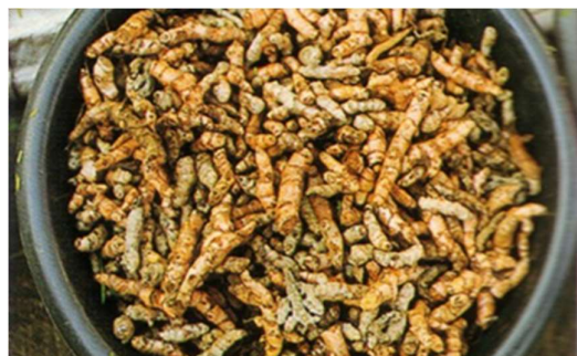
ภาพที่ 8 ขมิ้นตากแห้ง

(3) สีเหลืองได้จากขมิ้น โดยวิธีการทำ คือ นำขมิ้นสดมาตากจนแห้งสนิทประมาณ 2-3 แดด แล้วนำมาบดให้ละเอียด