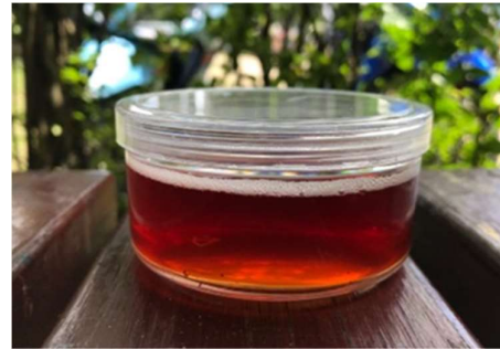
ภาพที่ 11 สีส้มจากเปลือกแสม

(5) สีนํ้าตาลออกส้มได้จากโกก่าง โดยการปอกเอาเปลือกไม้โกก่าง นำเปลือกไม้มาตากให้แห้ง และนำมาแช่ในน้ำ 3 วัน หลังจากนั้นนำน้ำที่ได้มาต้มให้เดือด