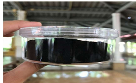
ภาพที่ 7 กะลามะพร้าวผง

(3) สีเหลืองได้จากขมิ้น โดยวิธีการทำ คือ นำขมิ้นสดมาตากจนแห้งสนิทประมาณ 2-3 แดด แล้วนำมาบดให้ละเอียด