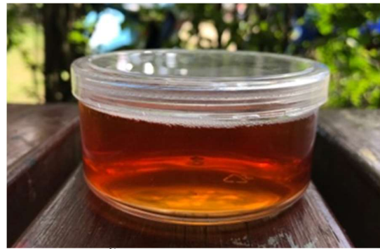
ภาพที่ 13 สีนํ้าตาลออกส้มจากเปลือกโกก่าง

การย้อมสีจากสีที่ได้จากวัตถุดิบตามธรรมชาตินับเป็นภูมิปัญญาไทยที่สืบทอดกันมาแต่อดีต แม้ว่ากระบวนการย้อมจะยุ่งยาก สีที่ย้อมได้ซีดจางง่าย ไม่คงทนต่อแสงและการซัก แต่ความนิยมในการใช้ผลิตภัณฑ์ย้อมสีธรรมชาติกลับเพิ่มมากขึ้นทั้งในประเทศและต่างประเทศ ด้วยเหตุผลที่สำคัญ คือ ทำให้ผู้สวมใส่ไม่เกิดอาการแพ้และของเสียที่เกิดขึ้นไม่ก่อให้เกิดมลพิษต่อสิ่งแวดล้อม ข้อจำกัดในการพัฒนาผลิตภัณฑ์