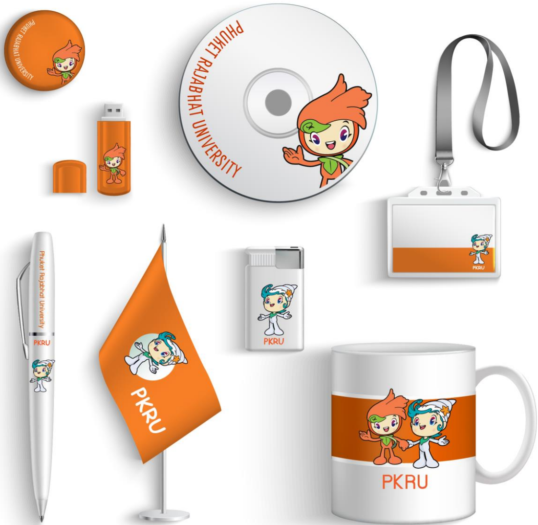
ภาพที่ 3 ภาพการสื่อสารสัญลักษณ์นำโชคเพื่อการรับรู้สำหรับมหาวิทยาลัยราชภัฏภูเก็ต