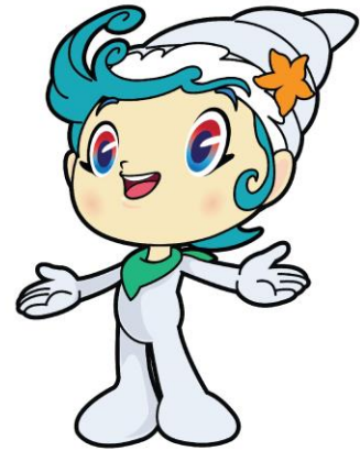
ภาพที่ 1 ขั้นตอนการสร้างสรรคผลงานสัญลักษณ์นำโชคที่มีที่มาจากด้านธรรมชาติและการทำงานที่เกี่ยว องค์ประกอบจากท้องทะเล