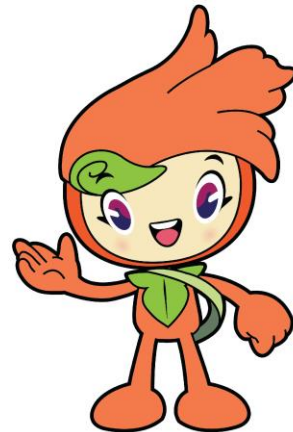
ภาพที่ 2 ขั้นตอนการสร้างสรรคผลงานสัญลักษณ์นำโชคที่มีที่มาจากพืชพันธุ์ ดอกแคแสด สัญลักษณ์ประจำมหาวิทยาลัยราชภัฏภูเก็ต